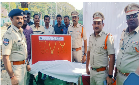
హనుమకొండ జిల్లా జనవరి 08 (మనవార్త ప్రతినిధి కొడపాక శ్రీకాంత్):