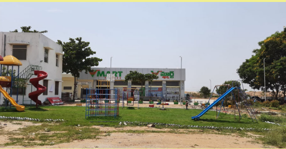
గజ్వేల్ జనవరి 07(మన వార్త ప్రతినిధి జీ మురళి)

ద్దిపేట జిల్లా గజ్వేల్ పట్టణంలో ఏర్పాటుచేసిన విమాన్ షోరూం వినియోగదారుల మన్నన పొందుతూ మంచి గుర్తింపు పొందింది మంగళవారం విమాన్ యాజమాన్యం వారు మాట్లాడుతూ వినియోగదారుల