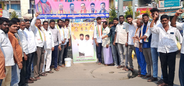
జమ్మికుంట, జనవరి 07(మన వార్త ప్రతినిధి):

రాష్ట్ర ప్రభుత్వం జనవరి 26వ తేదీ నుంచి రాష్ట్రంలో అమలు చేయబోతున్న రైతు భరోసా, ఇందిరమ్మ ఆత్మీయ భరోసా కార్యక్రమాలకు సంపూర్ణ మద్దతు ప్రకటిస్తూ కాంగ్రెసు