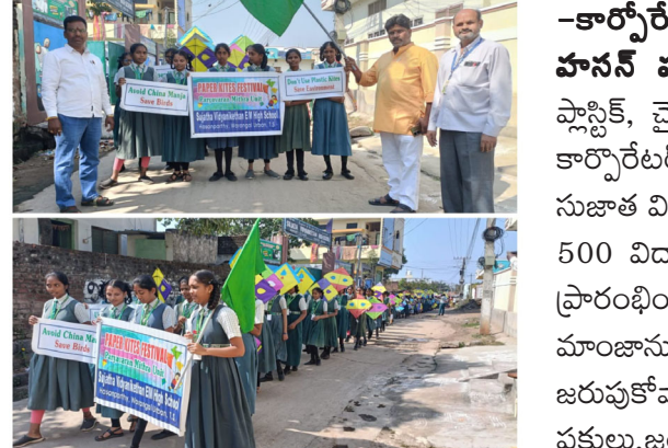
-వతం గులకు చైనా మాంజాలను వాడొద్దు...