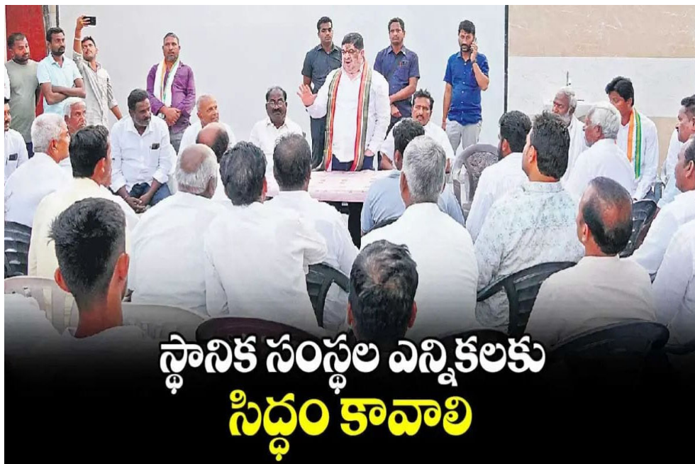
స్థానిక సంస్థల ఎన్నికలకు సిద్ధం కావాలి

త్వరలో జరిగే స్థానిక సంస్థల ఎన్నికలకు సిద్ధం కావాలని మంత్రి పొన్నం ప్రభాకర్ కార్యకర్తలకు పిలుపునిచ్చారు. బుధవారం మండలంలోని జిల్లెలగడ్డలో నిర్వహించిన హుస్సాబాద్ మండల ముఖ్య కార్యకర్తల సమావేశంలో ఆయన మాట్లాడారు. ప్రతి గ్రామంలో పార్టీ జెండాను ఎగరవేయాలని, ప్రభుత్వం అమలు చేస్తున్న పథకాలను ప్రజల్లోకి తీసుకెళ్లాలని సూచించారు. ఆర్డీసీ బస్సుల్లో ఇప్పటి వరకు రూ. 126 కోట్ల మంది మహిళలు ఉచితంగా ప్రయాణం చేశారని తెలిపారు. 200 యూనిట్ల ఉచిత విద్యుత్ , రూ. 5000 గ్యూస్ అందిస్తున్నామని, ఇవి ఎవరికైనా రాకపోతే గ్రామాల్లో ఫిర్యాదు చేయాలని సూచించారు. రైతుకు ఒకేసారి రూ. 2 లక్షల రుణమాఫీ చేసిన ఘనత కాంగ్రెస్ కే దక్కుతుందని చెప్పారు. ప్రభుత్వం ఇప్పటికే 55 వేల ఉద్యోగాలు భర్తీ చేసినది తెలిపారు. త్వరలోనే గౌరవెల్లి కాలనీ పనులు పూర్తి చేసి సాగు నీరు అందిస్తామని చెప్పారు. హుస్సాబాద్ ప్రాంతం నుంచి ఇతర దేశాలకు ఉపాధి కోసం వెళ్లే వారికి టాంకాం కంపెనీ ద్వారా శిక్షణ ఇచ్చి ఉద్యోగ అవకాశాలు కల్పించేలా చేస్తామని హామీ ఇచ్చారు. ప్రభుత్వం నియోజకవర్గానికి 3,500 ఇందిరమ్మ ఇళ్లు మంజూరు చేసిందని, లబ్ధిదారుల ఎంపిక పారదర్శకంగా జరుగుతోందని తెలిపారు. త్వరలోనే ఇళ్ల పనులకు శంకుస్థాపన చేస్తామని చెప్పారు. అసంతోరం క్యాంపు ఆఫీస్ లో మున్సిపల్ కౌన్సిల్లర్లు, టౌన్ ముఖ్య నేతలతో సమావేశం ఏర్పాటు చేశారు. ఇటీవల యూత్ ఎన్నికల్లో గెలుపొందిన వారిని అభినందించారు. ఈ సమావేశంలో లైబ్రరీ చైర్మన్, లింగమూర్తి, సింగిల్ విండ్ చైర్మన్ శివప్రసాద్ తదితరులు ఉన్నారు.