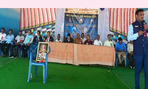
గంభీరావుపేట జనవరి 2 మన వార్త ప్రతినధి గంభీరావుపేట లయన్స్ క్లబ్, ఆస్పర్స్యంలో పదవ తరగతి చదువుతున్న విద్యార్థులకు ప్రేరణ కార్యక్రమం ఏర్పాటుచేయటం జరిగింది. ఈ కార్యక్రమంలో మండలానికి సంబంధించిన, ప్రభుత్వ ప్రైవేటు, అమ్మ పాఠశాలల్లో, పదవ తరగతి చదువుతున్న సుమారు 400 మంది,