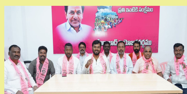
జహీరాబాద్, జనవరి 27 (మన వార్త):

ఇందిరమ్మ ఆత్మీయ భరోసా పథకంలో కాంగ్రెస్ ప్రభుత్వం రైతులను మోసం చేస్తోందని జహీరాబాద్ బిఆర్ఎస్ నాయకులు ఆరోపించారు. జహీరాబాద్ ఎమ్మెల్యే క్యాంపు కార్యాలయంలో