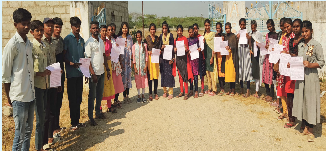
ఇల్లంతకుంట జనవరి: 27 ( మన వార్త ప్రతినిధి బొంగోని రాజు)