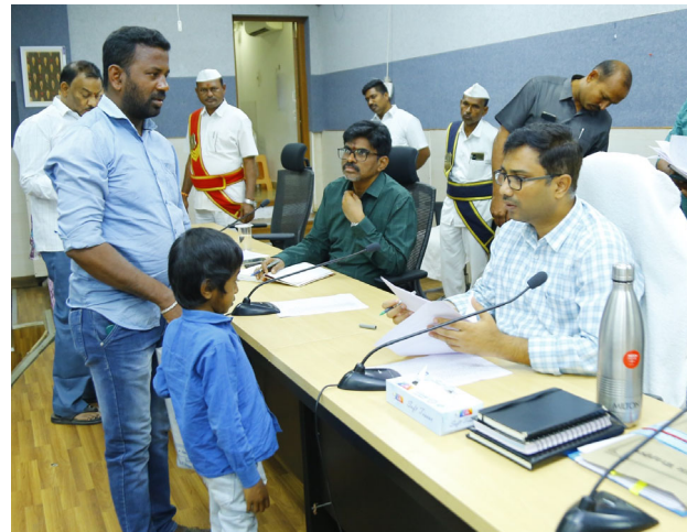
ములుగు జనవరి 27 మనవార్త

పెండింగ్ లో ఉన్న ప్రజావాణి అర్జీలను వచ్చే వారంలోగా పరిష్కరించాలని జిల్లా కలెక్టర్ దివకర్ టి.ఎస్. అధికారులను ఆదేశించారు. సోమవారం కలెక్టరేట్ సమావేశ మందిరంలో నిర్వహించిన ప్రజావాణి కార్యక్రమంలో జిల్లాలోని వివిధ ప్రాంతాల నుండి 38 మంది తమ సమస్యల పరిష్కారం కోసం దరఖాస్తు చేసుకున్నారు. అట్టి అర్జీలను సత్కరమే పరిష్కారం చేయాలని సంబంధిత అధికారులను ఆయన ఆదేశించారు. ఈ రోజు ప్రజావాణి కార్యక్రమంలో 38 దరఖాస్తులు రాగా అత్యధికంగా భూ సమస్యలు 08 గృహ నిర్మాణ శాఖకు 07, పెన్షన్ 01, ఉపాధి కల్పనకు 02 ఇతర శాఖలకు సంబంధించినవి 20 దరఖాస్తులు అందాయని పేర్కొన్నారు. అనంతరం జిల్లా కలెక్టర్ అధికారులతో మాట్లాడుతూ జిల్లాలో ప్రతిష్టాత్మక నాలుగు పథకాలైన రైతు భరోసా, ఇందిరమ్మ ఇండ్లు, ఇందిరమ్మ ఆత్మీయ భరోసా, మరియు నూతన రేషన్ కార్డులు జారీ