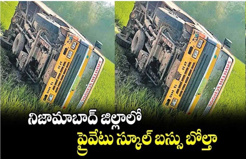
నిజామాబాద్ జిల్లాలో ప్రైవేటు స్కూల్ బస్సు బోల్తా