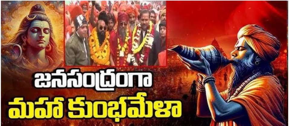
జనసంద్రంగా మహా కుంభమేళా

సనాతన హైందవ వేడుక మహా కుంభమేళాకు మౌని అమావాస్య రోజున 10 కోట్ల మంది భక్తులు వస్తారని యూపీ ప్రభుత్వం అంచనా వేస్తోంది. ప్రయాగ్ రాజ్ లో వైభవోపేతంగా జరుగుతున్న మహా కుంభమేళాలో యోగులు, అభ్యోరాలు, సిద్ధులు, భక్తుల పుణ్య స్నానాలు కొనసాగుతున్నాయి. మౌని అమావాస్య రోజున ఎలాంటి అవాంఛనీయ ఘటన జరుగకుండా, భక్తుల సౌకర్యార్థం ప్రభుత్వం ఏర్పాట్లు చేస్తోంది. ట్రాఫిక్, జనసందోహాలను క్రమబద్ధీకరించేందుకు ప్రత్యేక సిబ్బందిని వినియోగించనుంది