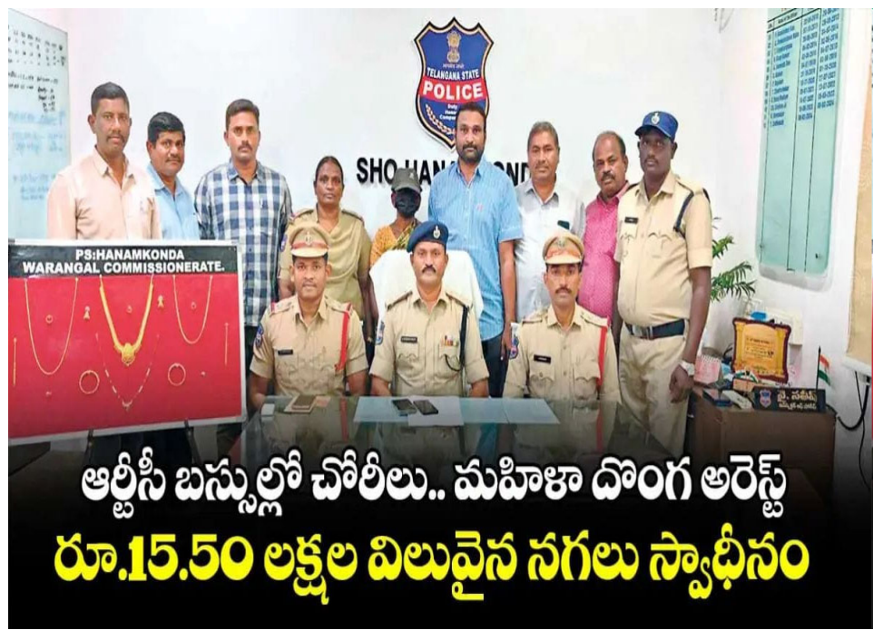
ఆర్టీసీ బస్సుల్లో చోరీలు.. మహిళా దొంగ అరెస్ట్ రూ.15.50 లక్షల విలువైన నగలు స్వాధీనం

మహిళా దొంగ అరెస్ట్ రూ.15.50 లక్షల విలువైన నగలు స్వాధీనం