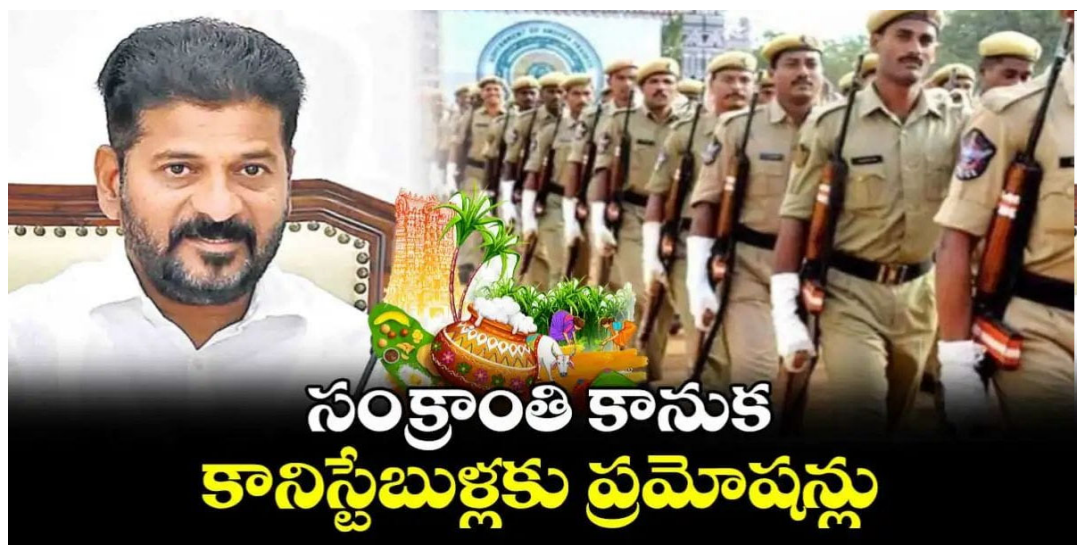
సంక్రాంతి కానుక కానిస్టేబుల్లకు ప్రమోషన్లు

మన వార్త తెలంగాణ ప్రభుత్వం కానిస్టేబుల్స్ కు సంక్రాంతి కానుక ప్రకటించింది. 1989, 1990 బ్యాచ్ లో ఎంపికైన పోలీస్ కానిస్టేబుల్స్ కు ప్రభుత్వం ప్రమోషన్ కల్పించింది. హైదరాబాద్ రిజిస్ట్రేషన్ 187వ ఎన్ బి లకు ఎన్ బి లు గా ప్రమోషన్ కల్పించింది. ఈ మేరకు డిజిపి జితేందర్ రెడ్డి ఆదేశాలతో మల్టీ జోన్ -2బి జి.వి.సత్యనారాయణ ప్రమోషన్లు ఇస్తూ ఉత్తర్వులు జారీ చేశారు. ప్రీ ప్రమోషన్ లో ట్రైనింగ్ పూర్తి చేసిన రోజునే ప్రమోషన్స్ ఇవ్వడంతో సిబ్బందిలో ఆనందోత్సవాలతో సంబరాలు చేసుకుంటున్నారు. సీఎం రేవంత్ రెడ్డికి కృతజ్ఞతలు తెలిపారు. గత బీఆర్ఎస్ సర్కార్ హయాంలో పోలీస్ డిపార్ట్ మెంట్ ను పెద్దగా వర్ణించుకోలేదు. కానిస్టేబుల్ల ప్రమోషన్స్ ను నిర్లక్ష్యం చేసింది. కోర్టుల్లో కేసులున్నాయంటూ ప్రమోషన్లు ఆపేసింది. ఇతర డిపార్ట్ మెంట్ లో తమతో పాటు జాయిన్ వారు పెద్ద పోజిషన్ లో ఉండగా.. తాము మాత్రం ఎక్కడికక్కడే మిగిలిపోవాల్సి వచ్చిందని కానిస్టేబుల్స్ బాధ పడేవారు. ఈ క్రమంలో 187 మందికి ప్రమోషన్ కల్పించింది కాంగ్రెస్ ప్రభుత్వం.