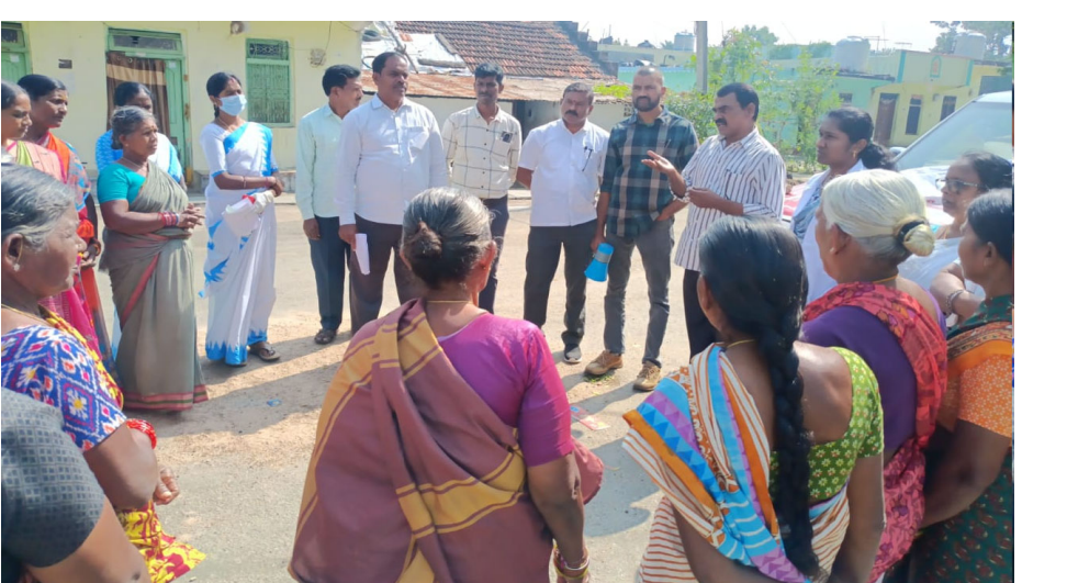
జమ్మికుంట, డిసెంబర్ 28( మన వార్త ప్రతినిధి):