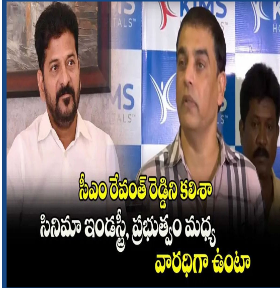
సీఎం రేవంత్ రెడ్డిని కలిశా సినిమా ఇండస్ట్రీ ప్రభుత్వం మధ్య వారీభిగా ఉంటా