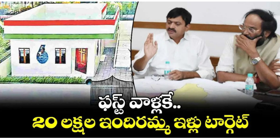
ఫస్ట్ వాళ్లకే.. 20 లక్షల ఇందిరమ్మ ఇళ్లు టార్గెట్