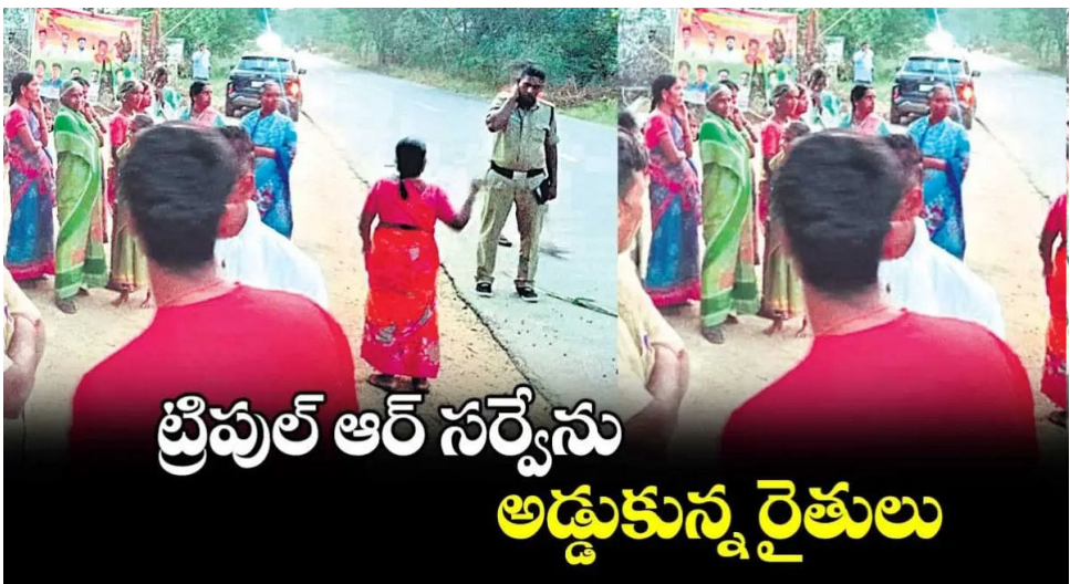
ట్రైపుల్ ఆర్ సర్వేను అడ్డుకున్న రైతులు

ట్రైపుల్ ఆర్ సర్వే కోసం వచ్చిన అధికారులను సిద్దిపేట జిల్లా వర్లలో మండలం సామలపల్లి రైతులు సోమవారం అడ్డుకున్నారు. వర్లలో మండలంలోని సామలపల్లి గ్రామంలో ఆర్ అండ్ బీ, రెవెన్యూ అధికారులు సర్వే నిర్వహించేందుకు వెళ్లారు. గజ్వేల్ తూప్రాన్ రహదారికి ఇరువైపులా ఉన్న భూమితోపాటు స్థిర, చరా ఆస్తుల వివరాలు నమోదు చేసేందుకు రెవెన్యూ సిబ్బందితో కలిసి ఆర్ అండ్ బీ అధికారులు చేరుకున్నారు. భూములు కోల్పోతున్న బాధిత రైతులు, గ్రామస్థులు తమకు న్యాయం చేసేవరకు సర్వే చేపట్టాల్దని అధికారులను అడ్డుకున్నారు. కొందరు రైతులు అధికారులతో వాగ్వివాదానికి దిగారు. ఇప్పటికే కాలువలు, రహదారుల నిర్మాణంతో కోట్ల విలువైన వ్యవసాయ భూమిని కోల్పోయామన్నారు. ఈ సారి భూములతో పాటు ఇళ్లను కూడా కోల్పోవాల్సి వస్తుందని ఆందోళన వ్యక్తం చేశారు. రూ. 3 కోట్లకు పైగా ఎకరం భూమి విలువ ఉందని, తాము అంతవిలువైన భూములు కోల్పోతే ఇచ్చే పరిహారంతో గుంట భూమి కూడా కొనుగోలు చేయలేమని వాపోయారు. తమకు తగిన న్యాయం జరిగితేనే తమ భూములను ఇస్తామని చెప్పి, గ్రామస్థులు, రైతులు అధికారులను అక్కడ నుంచి వెనక్కి పంపించేశారు. విషయం తెలుసుకున్న బేగంపేట పోలీసులు ఘటన స్థలానికి చేరుకుని రైతులకు సచ్చజిచ్చారు.