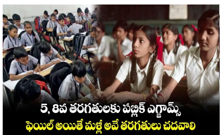
5, 8వ తరగతులకు పబ్లిక్ ఎగ్జామ్స్ ఫెయిల్ అయితే మళ్ళీ అవే తరగతులు చదవాలి

తరగతులు జారీ చేసింది. అందులో భాగంగా విద్యాహక్కు చట్టానికి సవరణలు చేసింది. నూతనంగా తీసుకొచ్చిన పాలసీతో కేంద్రీయ విద్యాలయాలలో విద్యావిధానంలో రాసున్న మార్పులు: గతంలో ఉన్న నో డిటెన్షన్ పాలసీని రద్దు చేసినట్లు కేంద్ర విద్యాశాఖ ఉత్తర్వులు జారీ చేసింది. ఈ విధానం ప్రకారం 5, 8 తరగతిలో ఫెయిల్ అయితే ఫెయిల్ అయినట్లే.. ఫెయిల్ అయిన విద్యార్థులకు మరో రెండు నెలల్లో సప్లమెంటరీ పరీక్షలు నిర్వహిస్తారు. సప్లమెంటరీ పరీక్షల్లో పాసైతే విద్యార్థులను పైతరగతులకు అనుమతిస్తారు. సప్లమెంటరీ పరీక్షల్లో ఫెయిల్ అయితే మళ్ళీ అవే తరగతుల్లోనే కొనసాగాల్సి ఉంటుంది. విద్యార్థులు ఫెయిల్ అయినా కూడా 8వ తరగతి వరకు స్కూల్ నుండి తొలగించరాదు. ఈ నిర్ణయం 3 వేల కేంద్ర ప్రభుత్వ విద్యా సంస్థలకు వర్తిస్తుంది. కేంద్రీయ విద్యాలయం, నవోదయ విద్యాలయం, సైనిక్ స్కూల్స్ మొదలైన విద్యా సంస్థలకు వర్తిస్తాయి. 2019 విద్యాహక్కు చట్టంలో మార్పులు చేస్తూ ఈ మేరకు కేంద్ర విద్యాశాఖ ఉత్తర్వులు జారీ చేసింది