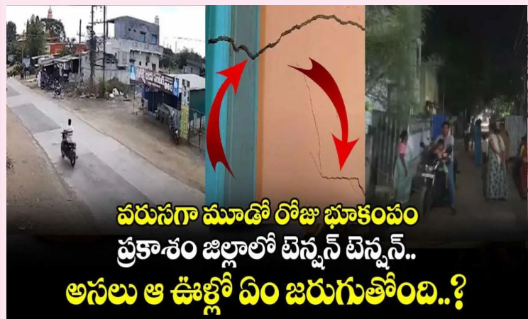
వరుసగా మూడో రోజు భూకంపం ప్రకాశం జిల్లాలో టెన్సన్ టెన్సన్.. అసలు ఆ ఊళ్లో ఏం జరుగుతోంది..?

ప్రకాశం జిల్లాలో టెన్సన్ టెన్సన్.. అసలు ఆ ఊళ్లో ఏం జరుగుతోంది..?