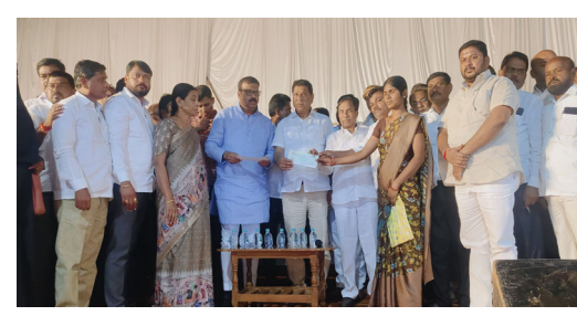
జహీరాబాద్, డిసెంబర్ 9 (మన వార్త):

జహీరాబాద్ ఎంపి సురేష్ కుమార్ శెట్టార్, ఎమ్మెల్యే కొనింటి మాణిక్ రావు, సెట్టిన్ చైర్మన్ ఎన్ గిరీధర్ రెడ్డి లు కలిసి జహీరాబాద్ నియోజకవర్గ కేంద్రం ఎస్సీ కన్వెన్షన్ ఫంక్షన్ హాల్ పస్తాపూర్ లో ఏర్పాటు చేసిన కార్యక్రమంలో లబ్ధిదారులకు షాటి ముబారక్, కళ్యాణ లక్ష్మి చెక్కులను పంపిణీ చేశారు. జహీరాబాద్ మండలం 445, మొగుడం పల్లి మండలం 134, కోహిర్ మండలం 165, ఝరాసంఘం మండలం 130, న్యాలూల్ మండలం 117 మంది లబ్ధిదారులకు గాను మొత్తం 991 మంది లబ్ధిదారులకు చెక్కులను అందించారు. ఇదిలా ఉండగా ప్రభుత్వ అధికారులు ప్రోటోకాల్ ను పాటించడం లేదని, ప్రభుత్వ కార్యక్రమాల నిర్వహణలో సరైన సమాచారం ఇవ్వడం లేదని ఎమ్మెల్యే అధికారులపై ఆగ్రహం వ్యక్తం చేశారు. ఈ కార్యక్రమంలో రెవెన్యూ, ఎంపిపి, పురపాలక సంఘం అధికారులు, కాంగ్రెస్, బిఆర్ఎస్ నాయకులు తదితరులు పాల్గొన్నారు.