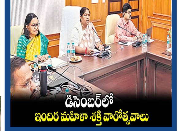
డిసెంబర్ లో ఇందిర మహిళా శక్తి వారోత్సవాలు