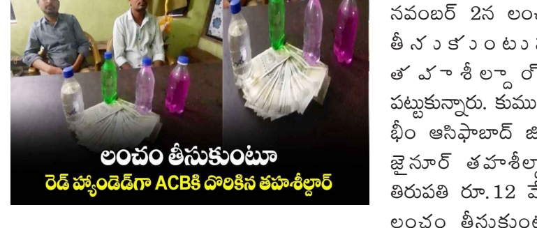
లంచం తీసుకుంటూ రెడ్ హ్యాండెడ్స్ ACBS డాలికిన్ తహశీల్దార్