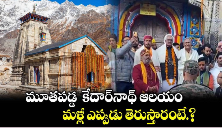
మూతపడ్డ కేదార్ నాథ్ ఆలయం మళ్ళీ ఎప్పుడు తెరుస్తారంటే?

మన వార్త ప్రముఖ పుణ్యక్షేత్రం కేదార్ నాథ్ ఆలయం మూతపడింది. శీతాకాల ప్రారంభం కావడంతో నవంబర్ 3 న ఉదయం 8:30 గంటలకు ఆలయం తలుపులు మూసివేశారు. శీతాకాలంలో ఆలయం మంచులో కూరుకుపోతుంది. ఈ నేపథ్యంలో ఉదయం పూజా కార్యక్రమాలు నిర్వహించిన అనంతరం పూజారులు గుడి తలుపులు మూసివేశారు. ఆర్మీ ఆధ్వర్యంలో భక్తి శ్రద్ధలతో శివయ్య పంచముఖి దేవత విగ్రహం శ్రీ ఓంకారేశ్వరాలయం, ఉఖీమర్ కు తీసుకుని వచ్చారు. ఈ సమయంలో జై బోలో శంకర్ నినాదాలు చేస్తూ వేలాది మంది భక్తులు స్వామివారి వెంట నడిచారు. వచ్చే 6 నెలల పాటు ఉఖీమర్లో పూజలు నిర్వహించనున్నారు. కేదార్ నాథ్ తో పాటు ఉత్తర కాశీలోని ప్రపంచ ప్రఖ్యాతి గాంచిన యమునోత్రి ధామ్ ఆలయం కూడా నవంబర్ 2 న మూతపడింది. వచ్చే ఆరు నెలల వరకు ఆలయం మూసి ఉంటుంది. యమునా దేవి గుడిని మధ్యాహ్నం 12.05 గంటలకు మూసివేశారు. చార్ ధామ్ లో ఒకటైన బద్రినాథ్ ఆలయాన్ని నవంబర్ 17 న మూసివేశారు. హిమవతం, శీతాకాలంలో తీవ్రమైన చలి కారణంగా, ఏటా అక్టోబర్ - నవంబర్ మాసాల్లో చార్ ధామ్ లు మూసివేసే వచ్చే ఏడాది 2025 సంవత్సరం ఏప్రిల్, మే నెలల్లో తెరుస్తారు.