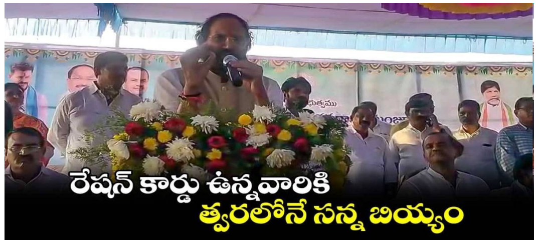
రేషన్ కార్డు ఉన్నవారికి త్వరలోనే సన్న బియ్యం

మన వార్త తెలంగాణ రాష్ట్రంలో సంక్రాంతి తర్వాత తెల్ల రేషన్ కార్డు ఉన్న వారికి సన్న బియ్యం ఇస్తామని పౌర సరఫరాల శాఖ మంత్రి ఉత్తమ్ కుమార్ రెడ్డి అన్నారు. ఈసారి వరి ధాన్యం 150లక్షల మెట్రిక్ టన్నులు ఉత్పత్తి అయ్యిందని ఆయన అన్నారు. ప్రోత్సహకంగా సన్న వరి ధాన్యం పండించిన రైతులకు రూ. 500 బోనస్ ఇస్తున్నామన్నారు ఆయన. గరిడేపల్లి మండలం గడ్డిపల్లి గ్రామంలో యంగ్ ఇండియా ఇంటిగ్రేటెడ్ స్కూల్ నిర్మాణానికి డిప్యూటీ సీఎం బట్టి విక్రమార్క, రోడ్డు %60%భవనల శాఖ మంత్రి కోమటిరెడ్డి వెంకట్ రెడ్డి, నీటి పారుదల శాఖ మంత్రి ఉత్తమ్ కుమార్ రెడ్డి శంకుస్థాపన చేశారు. ఈ సందర్భంగా అసెంబ్లీ ఎన్నికల్లో కాంగ్రెస్ పార్టీకి అంత మెజార్టీ ఇచ్చినందుకు ప్రజలకు ధన్యవాదాలు చెప్పారు. ఆరోగ్య శ్రీ ద్వారా రూ. 10లక్షల రూపాయలు ఉచిత వైద్యం, రూ. 18వేల కోట్లతో బుణ మాఫీ, అన్ని సౌకర్యాలతో అధునాత యంగ్ ఇండియా ఇంటిగ్రేటెడ్ స్కూల్ ఇలా ప్రభుత్వం అనేక సంక్షేమ పథకాలు రూపొందిస్తుందని మంత్రి ఉత్తమ్ కుమార్ రెడ్డి చెప్పారు. భారతదేశంలోనే ఎంతో ప్రతిష్టముగా ఇంటిగ్రేటెడ్ స్కూల్ మంజూరు చేసాము. సర్వే నెంబర్ 57లో ఇంటిగ్రేటెడ్ స్కూల్ ను రూ. 200కోట్లతో నిర్మించుకుంటున్నామని మంత్రి వివరించారు. ఈ స్కూల్ లో 4 నుంచి 12వ తరగతి వరకు క్లాసులు జరుగుతాయన్నారు. గరిడేపల్లి మండలం గడ్డిపల్లి గ్రామానికి వచ్చినందుకు ఉత్తమ్ కుమార్ రెడ్డి సంతోషం వ్యక్తం చేశారు. ఇక్కడ ఉన్నవారు కాంగ్రెస్ సభ్యులు కాదు. ఏరంతా మా కుటుంబ సభ్యులని అన్నారు.