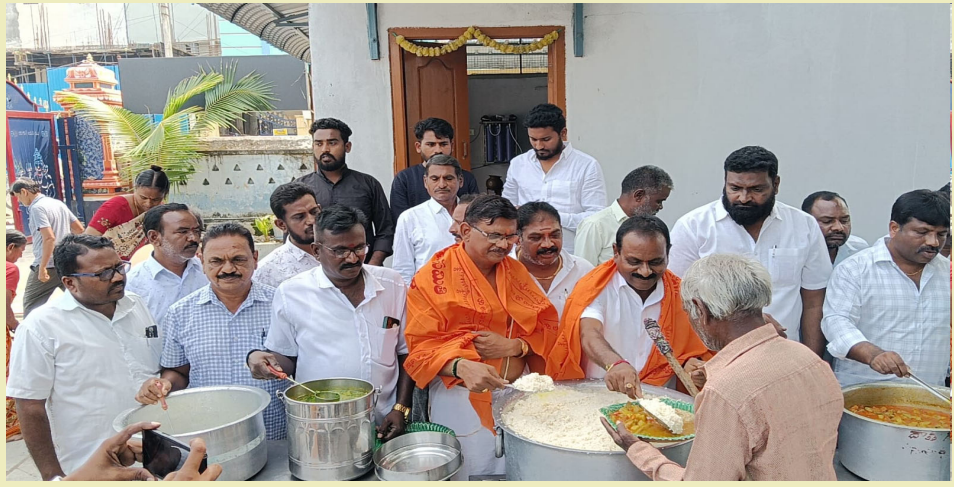
జమ్మికుంట, నవంబర్ 02( మన వార్త ప్రతినధి):