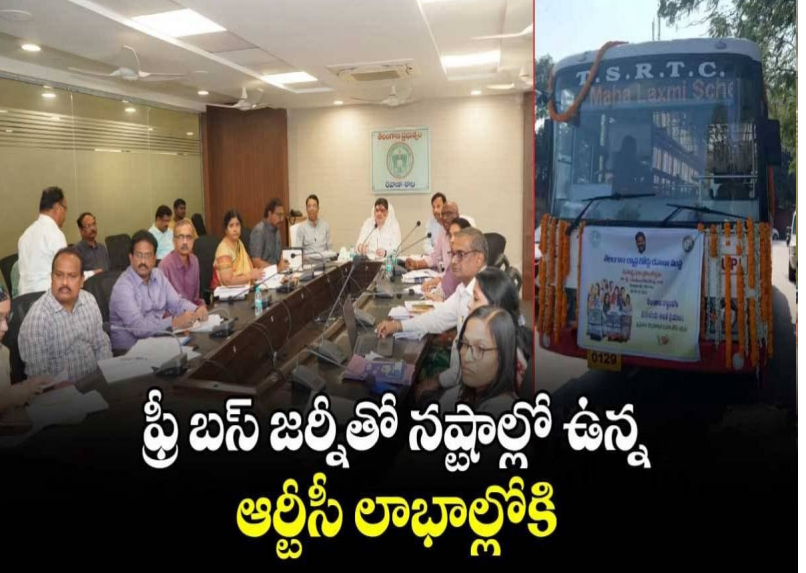
శ్రీ బస్ జర్నీతో నష్టాల్లో ఉన్న ఆర్టీసీ లాభాల్లోకి