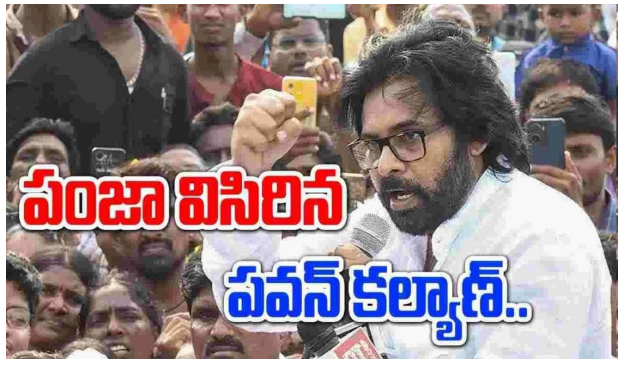
పంజా టెలివిజన్ పవన్ కల్యాణ్..

నియోజకవర్గాల్లో నిలబడిన ప్రతి ఎమ్మెల్యే.. ప్రత్యర్థులను చిత్తుచిత్తుగా ఓడించి గెలిచారు. దీంతో దేశంలోనే 100 శాతం స్ట్రయిక్ రేట్ నమోదు చేసిన పార్టీగా జనసేన నిలిచింది. తాజాగా మహారాష్ట్ర ఎన్నికల్లోనూ అదే సీన్ కనిపించింది. మహారాష్ట్ర ఎన్నికల్లో భాగంగా ఉప ముఖ్యమంత్రి పవన్ కల్యాణ్ ప్రచారం చేసిన ప్రతి చోటా ఎన్నియే అభ్యర్థులు విజయ ధంకా మోగించారు. బల్లార్ పూర్, చంద్రాపూర్, పుణె కంటోన్మెంట్, హద్సర్ పూర్, కన్యాపేట్, డెగ్లూర్, లాతూర్, జోలాపూర్ నియోజకవర్గాల్లో మహాయుతి అభ్యర్థులను గెలిపించాలంటూ పవన్ కల్యాణ్ ప్రచారం చేశారు. పవన్ బహిరంగ సభలు, రోడ్ షోలకు మహారాష్ట్ర ప్రజలు బ్రహ్మరథం పట్టారు. పవన్ వెళ్లిన ప్రతి చోటా ఇసుక వేస్తే రాలనంతా జనం హాజరయ్యారు. దీంతో స్థానిక నేతలు, ప్రత్యర్థులు పవన్ క్రేజ్ చూసి షాకయ్యారు. ఏపీ డిప్యూటీ సీఎం పవన్ కల్యాణ్ ప్రచారంతో మహాయుతి నేతల విజయం తథ్యమని పలువురు రాజకీయ విశ్లేషకులు అప్పుడే భావించారు. అనుకున్నట్లుగా ఆయా నియోజకవర్గాల్లో ఎన్నియే అభ్యర్థుల గెలుపు దాదాపు ఖాయమైంది. దీంతో పవన్ మరోసారి 100 శాతం రిజల్ట్ మార్చ్ చూపించారని విశ్లేషకులు చెబుతున్నారు. మహారాష్ట్రలో పవన్ స్టార్.. “పవన్” చూపించారని, ఆయన “పంజా” విసిరి ప్రత్యర్థులను చిత్తు చేశారంటూ జనసేన శ్రేణులు, పవన్ అభిమానులు సోషల్ మీడియాలో తెగ పోస్టులు పెడుతున్నారు. పవన్ రేంజ్ అంటే ఇదేంటంటూ తెగ సంబర పడిపోతున్నారు. కాగా, మహారాష్ట్ర ఎన్నికల్లో మహా వికాస్ అభూడి కేవలం 50 స్థానాలకే పరిమితం అయ్యింది.