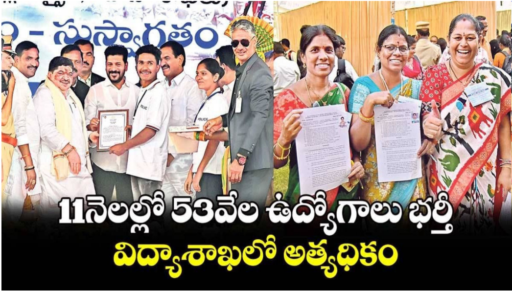
11 నెలల్లో 53వేల ఉద్యోగాలు భర్తీ విద్యాశాఖలో అత్యధికం