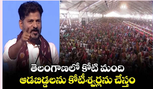
తెలంగాణలో కోటి మంది ఆడబిడ్డలను కోటి శిశువులను చేస్తాం

మన వార్త ఇందిరమ్మ రాజ్యంలో ప్రతి ఆడబిడ్డను కోటి శిశువులని చేస్తామని.. మా ప్రభుత్వంలో ఆడబిడ్డలే కీలకంగా ఉన్నారని సీఎం రేవంత్ రెడ్డి అన్నారు. పాలకుర్తి గడ్డ మీద కూడా కాంగ్రెస్ జెండా ఎగరేసిందే ఆడబిడ్డనేని ఎమ్మెల్యే యశస్విని రెడ్డిని ఉద్దేశించి సీఎం కామెంట్ చేశారు. ఇందిరమ్మ రాజ్యం రావాలని ప్రజలంతా కోరుకుని దీవించారని అన్నారు. రాష్ట్రంలోని మహిళలపై భారం పడకూడని తమ ప్రభుత్వం ధావిస్తోందని.. ఇందులో భాగంగానే మహిళలను పారిశ్రామికవేత్తలుగా చేసేలా నిర్ణయాలు తీసుకుంటున్నామని తెలిపారు. 2014 నుండి 2018 వరకు కేసీఆర్ కేబినెట్ లో ఒక్క మహిళా మంత్రి కూడా లేరని.. మా కేబినెట్ లో ఇద్దరు వరంగల్ మహిళలకు అవకాశం ఇచ్చామన్నారు. మాది మహిళల రాజ్యమని గర్వంగా చెబుతున్నానని అన్నారు. తెలంగాణలో కాంగ్రెస్ అధికారంలోకి వచ్చి ఏడాది కావస్తోన్న సందర్భంగా ప్రభుత్వం ప్రజా పాలన-