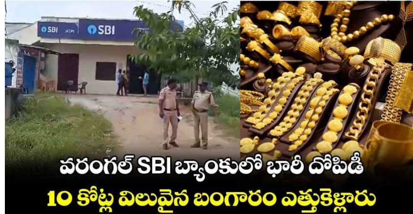
వరంగల్ SBI బ్యాంకులో భారీ దోపిడీ 10 కోట్ల విలువైన బంగారం ఎత్తుకెళ్లారు

మన వార్త ఇటీవల ఏటీఎంలు టార్గెట్ గా చేసుకున్న దొంగలు ఇప్పుడు ఏకంగా బ్యాంకులకే కన్నం పెడుతున్నారు. పక్కా ప్లాన్ తో బ్యాంకుల్లో రాబరి చేస్తున్నారు. లేటెస్ట్ గా వరంగల్ లోని ఎస్బిబి బ్యాంకులో దొంగలు భారీ దోపిడీ పాల్పడ్డారు. వరంగల్ జిల్లా రాయపర్తి మండల కేంద్రంలోని ఎస్బిబి బ్యాంక్ లో దొంగలు లాకర్లలో భద్రపరిచిన బంగారం ఎత్తుకెళ్లారు. గ్యాస్ కట్టర్ తో కిటికీని కట్ చేసి బ్యాంకు లోపలికి ప్రవేశించిన దొంగలు.. సుమారు 10 కోట్ల విలువైన బంగారం ఎత్తుకెళ్లినట్లు తెలుస్తోంది. బ్యాంకు అధికారుల ఫిర్యాదుతో దర్యాప్తు చేస్తున్నారు పోలీసులు. నిందితులను గుర్తించేందుకు.. సీసీటీవీ ఫుటేజీ పరిశీలించేందుకు ప్రత్యేక టీంలను ఏర్పాటు చేశారు.