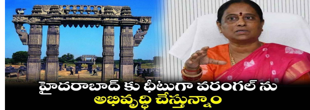
హైదరాబాద్ కు ఢిల్లీగా వరంగల్ ను అభివృద్ధి చేస్తున్నాం