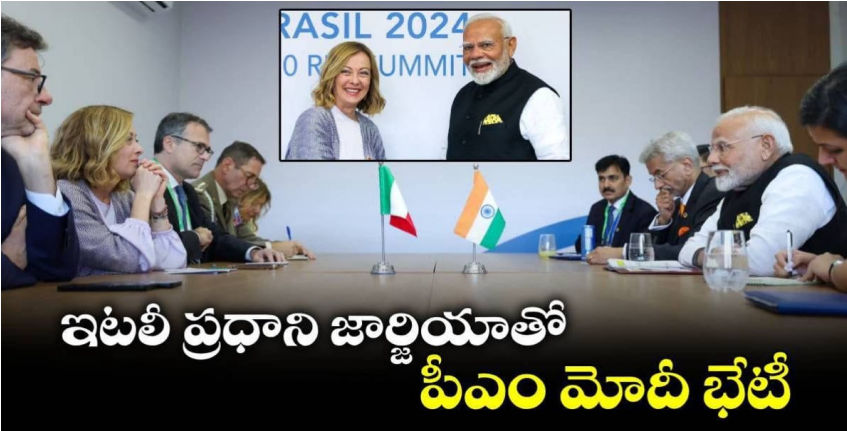
ఇటలీ ప్రధాని జార్జియాతో సీఎం మోదీ భేటీ

మన వార్త బ్రెజిల్ లో జరుగుతున్న జీ 20 సమ్మిట్ సందర్భంగా ప్రధాని మోదీ, ఇటలీ ప్రధాని జార్జియా మెలోని ద్వైపాక్షిక సమావేశమయ్యారు. రక్షణ, భద్రత, వాణిజ్యం, టెక్నాలజీ రంగాల్లో సంబంధాలను బలోపేత చేయడంపై ఇరుదేశాల నేతలు ఈ సమావేశంలో చర్చించారు. సమావేశం అనంతరం ప్రధాని మోదీ సోషల్ మీడియా ప్లాట్ ఫాం%౭% లో ఓ పోస్ట్ చేశారు. "రియోడిజెసిరో జీ 20 సదస్సు సందర్భంగా ఇటలీ ప్రధాని జార్జియా మెలోనిని కలిసినందుకు సంతోషిస్తున్నాను. రక్షణ, భద్రత, వాణిజ్యం, సాంకేతిక రంగాల్లో సంబంధాలను పెంచుకోవడంపై మా చర్చలు జరిగాయి. సంస్కృతి, విద్యా, ఇతర రంగాల్లో సహకారం పెంపొందించే మార్గాలను కూడా చర్చించామని" పోస్టులో ప్రధాని మోదీ రాశారు. అనంతరం నార్వే ప్రధాని జోనాస్ గహార్ స్టోర్ తో మోదీ ద్వైపాక్షిక సమావేశమయ్యారు. అంతకుముందు ఇండోనేషియా, పోర్చుగల్ దేశాల నేతలతో కూడా మోదీ సమావేశమయ్యారు. వాణిజ్యం, రక్షణ వంటి రంగాల్లో ఇరుదేశాలతో సంబంధాలను బలోపేతం దిశగా చర్చలు సాగించారు.