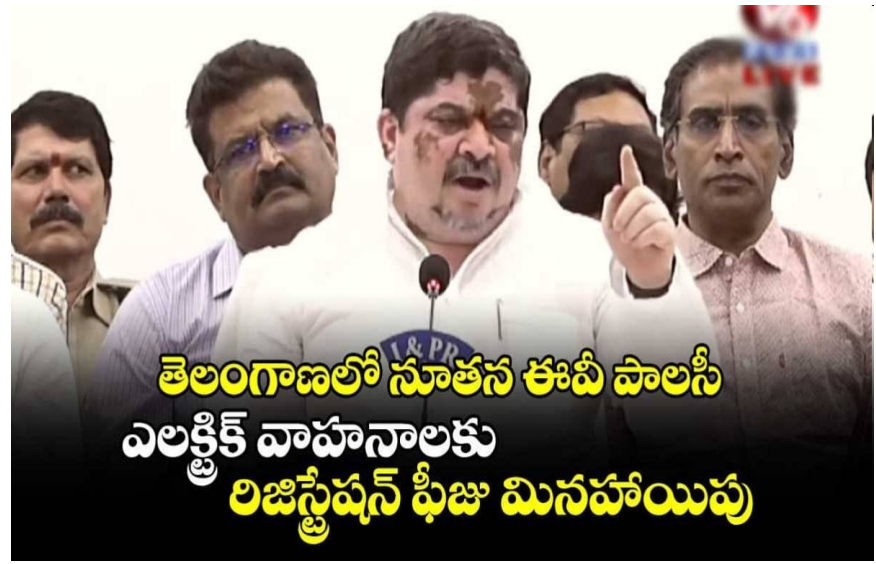
తెలంగాణలో నూతన ఈవీ పాలసీ ఎలక్ట్రిక్ వాహనాలకు రిజిస్ట్రేషన్ ఫీజు మినహాయిపు

తెలంగాణలో సోమవారం నుంచి నూతన ఈవీ పాలసీ అమల్లోకి తీసుకువస్తున్నట్లు మంత్రి పొన్నం ప్రభాకర్ ప్రకటించారు. జీవో 41 ద్వారా కొత్త ఈవీ పాలసీ అమలు కానున్నట్లు తెలిపారు. గతంలో 2020-2030 ఎలక్ట్రిక్ వెహికల్ పాలసీ తీసుకొచ్చారని గుర్తుచేశారు. జీవో నెంబర్ 41 ద్వారా 2026, డిసెంబర్ 31 వరకు ఈ నూతన ఎలక్ట్రిక్ వెహికల్ పాలసీ అమల్లో ఉంటుందని వివరించారు. ఎలక్ట్రిక్ వాహనాలకు రిజిస్ట్రేషన్ ఫీజును మినహాయిస్తున్నట్లు మంత్రి ప్రకటించారు. హైదరాబాద్ పరిధిలో ఎలక్ట్రిక్ బస్సులను ప్రవేశపెడుతున్నామని, ఢిల్లీలా హైదరాబాద్లో కాలుష్యం సమస్య తలెత్తకూడదని చెప్పారు. తెలంగాణలో ఎలక్ట్రిక్ వాహనాలకు పరిమితి లేదని తెలిపారు. కాలుష్య రహిత నగరంగా హైదరాబాద్ మార్చాలని ప్రణాళికలు తెచ్చామని చెప్పారు. ఎలక్ట్రిక్ బస్సులు కొన్నట్లైతే, కార్లు, ఆర్టీసీ బస్సులు, ఇతర సంస్థల బస్సులకు 100 శాతం ట్యాక్స్ మినహాయిపు చేయాలని నిర్ణయం తీసుకున్నామని మంత్రి వెల్లడించారు. హైదరాబాద్ నగరంలో కాలుష్యాన్ని తగ్గించాలంటే ఎలక్ట్రిక్ వెహికల్స్ పై పూర్తి స్థాయి అవగాహన కల్పించాలని పొన్నం చెప్పారు. హైదరాబాద్లో ఇప్పుడున్న మూడు వేల బస్సులు స్థానంలో ఎలక్ట్రిక్ బస్సులు తేవాలని సీఎం నిర్ణయం తీసుకున్నారని మంత్రి తెలిపారు. త్వరలోనే సిటీలో మొత్తం ఎలక్ట్రిక్ ఆర్టీసీ బస్సులు నడుస్తాయని, అయితే అందుకు కొంత ఇన్ఫ్రాస్ట్రక్చర్ రావాల్సి ఉందని పేర్కొన్నారు. ఎలక్ట్రిక్ వాహనాలకు ప్రాధాన్యత ఇచ్చి భవిష్యత్ తరాలకు కాలుష్యం నుంచి కాపాడాలని మంత్రి కోరారు.