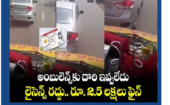
అంబులెన్స్ కు దారి ఇవ్వలేదు లైసెన్స్ రద్దు.. రూ. 2.5 లక్షలు ఫైన్

కారు ఉంది కదా అని ఓ ప్రభుద్దుడు ఎంతో జాలీగా రోడ్డుపై వెళుతున్నాడు. వెనుక ఏ వాహనం వస్తుంది.. అది ఎలాంటిది.. అందులో ఎవరుంటారు.. అనేది గమనించకుండా ఎంజాయి చేస్తూ వెనుక ఉన్న వాహనాన్ని దారి ఇవ్వకుండా రోడ్డుమీద పోతున్నాడు. ఇక అంతే ఈ విషయాన్ని గమనించిన పోలీసులు ఆ కారు యజమానికి షాక్ ఇచ్చారు. ఈ ఘటన కేరళలో జరిగింది. ఈ వీడియో సోషల్ మీడియాలో వైరల్ గా మారింది. కేరళలో ఓ కారు ఓనర్ కు పోలీసులు రుల్ క ఇచ్చారు. అంబులెన్స్ కు దారి ఇవ్వనందుకు కారు యజమానికి రూ. 2.5 లక్షల జరిమానాతో పాటు అతని లైసెన్స్ ను రద్దు చేశారు. వైద్యపరంగా ట్రీట్ మెంట్ అత్యవసరమయితే అంబులెన్స్ ల ద్వారా పేషంట్ ను ఆస్పత్రికి తరలిస్తారు. జనాల ప్రాణాలను కాపాడే అంబులెన్స్ లకు ట్రాఫిక్ రూల్స్ ఉండవు. ముందు.. వెనుకా ఎలాంటి వాహనాలు ఉన్నా.. అంబులెన్స్ వస్తుందంటే దారి ఇస్తారు. కానీ ఈ వీడియోలో ప్రాణాపాయ స్థితిలో ఉన్న రోగిని అంబులెన్స్ లో ఆస్పత్రికి తీసుకెళ్లుతున్నాడు. అయితే ఎదురుగా వెళ్తున్న ఓ కారు.. అంబులెన్స్ ముందుకు వెళ్లేందుకు దారి ఇవ్వలేదు. అంబులెన్స్ డ్రైవర్ సైరన్ మోగిస్తూనే ఉన్నాడు. కానీ అదేమీ ఆ డ్రైవర్ చేయకపోయింది. అన్ని వాహనాలు దారి ఇవ్వగా.. మారుతి సియాజ్ కారు యజమాని మాత్రం దారి ఇవ్వలేదు. ఈ ఘటనను అంబులెన్స్ లో ముందు కూర్చున్న వ్యక్తి వీడియో రికార్డ్ చేసి సోషల్ మీడియాలో పోస్ట్ చేశారు. ఈ వీడియో వైరల్ గా మారడంతో... పోలీసులు స్పందించారు. కారు యజమాని ఇంటికి వెళ్లి.. రూ. 2.5 లక్షలు ఫైన్ తో పాటు అతని డ్రైవింగ్ లైసెన్స్ రద్దు చేసినట్లు సమాచారం అందుతోంది.