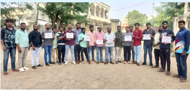
వేములవాడ నవంబర్ 11 ( మన వార్త ప్రతినిధి దెబ్బేటి ప్రవీణ్ )

వేములవాడ పట్టణంలో మూడు రోజులపాటు కటింగ్ షాపులను మూసివేస్తున్నట్లు నాలుగు బ్రాహ్మణ కులస్తులు సోమవారం తెలిపారు. ఈ సందర్భంగా వారు మాట్లాడుతూ పట్టణంలో