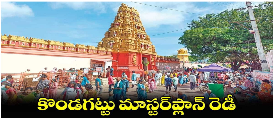
కొండగట్టు మాస్టర్ ప్లాన్ రెడీ