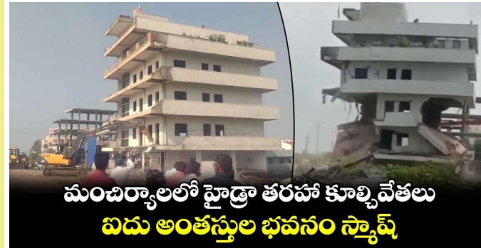
మంచెలపై హైద్రా తరహా కూల్చివేతలు ఐదు అంతస్తుల భవనం స్ట్రాప్స్

మంచెలపై జిల్లాలో హైద్రా తరహా కూల్చివేతలు కొనసాగుతున్నాయి. మంచెలపై నన్నూర్ మున్సిపాలిటీ పరిధిలోని సర్వేనంబర్ 42 లో ఆక్రమంగా నిర్మించిన ఐదు అంతస్తుల బిల్డింగ్ ను మున్సిపాలిటీ అధికారులు కూల్చివేశారు. సర్వే నంబర్ 40 డాక్యుమెంట్?లతో మున్సిపల్ పర్మిషన్ తీసుకొని సర్వే నంబర్ 42లో ఐదు అంతస్తుల మేర నిర్మాణం చేయడంతో అధికారులు చర్యలు తీసుకున్నారు. బిల్డింగ్ ఓనర్ కు మున్సిపల్ అధికారులు 2022 నుంచి ఇప్పటివరకు నోటీసులు జారీ చేశారు. తాజాగా మరోసారి ముందస్తు నోటీసులు అందించారు. స్పందించకపోవడంతో రెవెన్యూ, పోలీసుల సమక్షంలో కూల్చివేతలను కొనసాగిస్తున్నారు. సామాన్య సుబ్జుడితో ఖాళీ చేయించి జేసీబీలతో కూల్చివేశారు. బీఆర్ఎస్ హయాంలో రాజకీయ పలుకుడితో ఓనర్ అక్రమ బిల్డింగ్? నిర్మాణాన్ని కాపాడుకున్నారు.