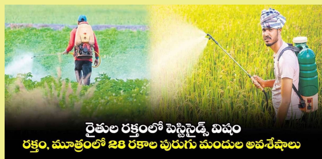
రైతుల రక్తంలో పెస్టిసైడ్స్ విషం రక్తం, మూత్రంలో 28 రకాల పురుగు మందుల అవశేషాలు

రక్తం, మూత్రంలో 28 రకాల పురుగు మందుల అవశేషాలు