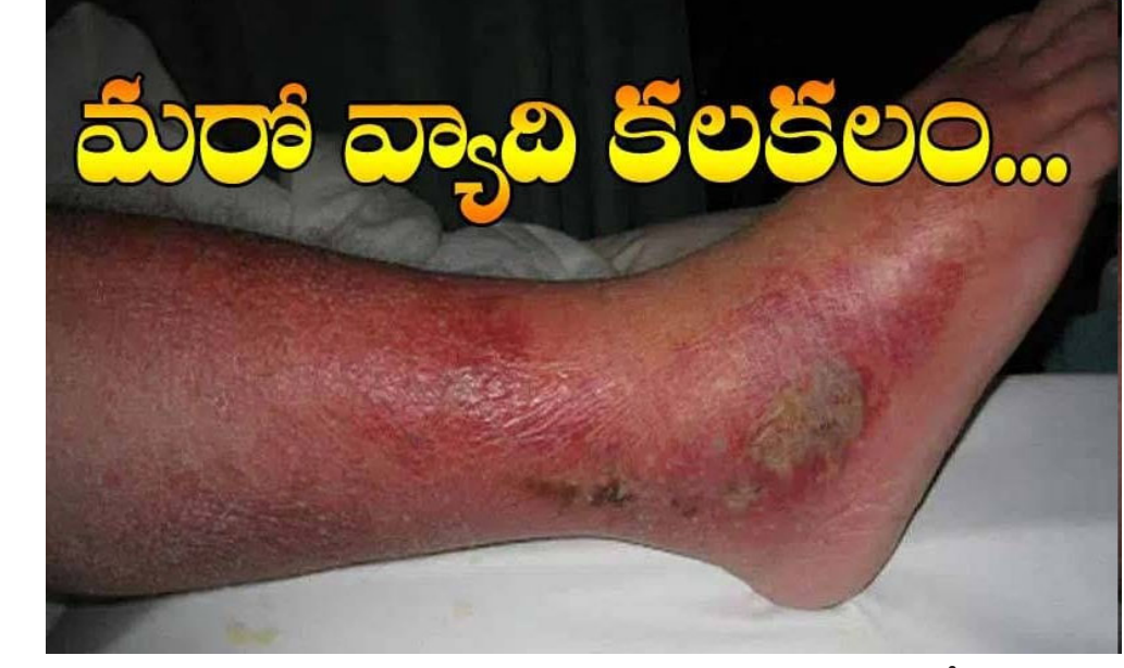
మరో వ్యాధి కలకలం...

మన వార్త కరీంనగర్ జిల్లాలో మరో వ్యాధి కలకలం రేపుతోంది. ఇప్పటికే మంకీపాక్స్ భయం కొనసాగుతుండగా.. ఇప్పుడు కొత్తగా ఓ చర్మ వ్యాధి భయపెడుతోంది. ప్రస్తుతం మంకీపాక్స్ అనే వైరస్ ప్రపంచవ్యాప్తంగా విజృంభిస్తోంది. దీని కారణంగా మరణాలు కూడా భారీగానే సంభవిస్తున్నాయి. దాంతో ప్రపంచ ఆరోగ్య సంస్థ అన్ని దేశాలను అప్రమత్తం చేసింది. ఇటీవల ఇండియాలోనూ ఒక మంకీ పాక్స్ కేసు నమోదు కావడంతో కేంద్ర ప్రభుత్వం అప్రమత్తమైంది. అన్ని రాష్ట్రాలను అప్రమత్తం చేసింది. అయితే ఇప్పుడు కరీంనగర్ జిల్లాలో ఓ కొత్త వ్యాధి ప్రజలను భయపెడుతోంది. ఈ వ్యాధి మొదట దురదతో మొదలై క్రమంగా గాయంగా మారుతున్నది. ఇప్పటికే అక్కడ వందల కేసులు నమోదయ్యాయి. ఈ సెల్యులైటిస్ వ్యాధి సాధారణ బ్యాక్టీరియల్ ఇన్ఫెక్షన్. కానీ వ్యాధి తీవ్రతతో ప్రమాదకరంగా మారుతున్నది. ఈ చర్మ వ్యాధి ఎక్కువగా కాళ్ళపై ప్రభావం చూపుతుంది. నిర్లక్ష్యం వహిస్తే శరీర భాగాలకు సోకే ప్రమాదం ఉంది. సెల్యులైటిస్ వ్యాధి ఎక్కువగా వర్షాకాలంలో వస్తుంది. ఏటా పదుల సంఖ్యలో ఉండే ఈ వ్యాధి బాధితులు ఈసారి వందల్లో ఉన్నారు.