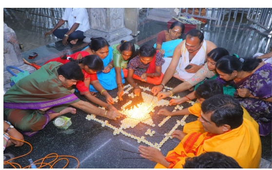
వేములవాడ, సెప్టెంబర్ 30 (మన వార్త ప్రతినిధి నందు రావు):

బుధవారం అమావాస్య ఉన్న నేపథ్యంలో మంగళవారం చేయాల్సిన బొడ్డెమ్మ పండగ సోమవారం వేములవాడ శ్రీ రాజరాజేశ్వర స్వామి వారికి ఇష్టమైన రోజు కావడంతో బొడ్డెమ్మ పండుగను వేములవాడ శ్రీరాజరాజేశ్వరస్వామివారి సన్నిధిలో మహిళలు భక్తిశ్రద్ధలతో చేశారు. దీంతో పండుగ వాతావరణం నెలకొంది. తెలంగాణలో సంస్కృతి, సంప్రదాయాలు దాదాపు అన్ని ప్రకృతితో ముడిపడి ఉంటాయి. అలాంటివాటిలో బొడ్డెమ్మ పండుగ ఒకటి. బతుకమ్మ, బోనాల పండుగలు ఎంత విశిష్టమైనవో, బొడ్డెమ్మకు కూడా అంతే ప్రాధాన్యత ఉందని మహిళ భక్తులు, అర్చకులు చెబుతున్నారు. అయితే దీనిని కూడా మహిళలే చేసుకుంటారు. బొడ్డె అంటే చిన్న అని అర్థం వస్తుందని, బొడ్డెమ్మ అంటే చిన్న పిల్ల అనే అర్థంతో ఈ పండుగ జరుపుకొంటామని మహిళ, భక్తులు, వెల్లడించారు. బాలికలు, చిన్నారులు, మొదలుకొని మహిళలు దీనిని చేసుకుంటారు. ఇది కూడా మట్టి, ప్రకృతి తో, పూలతో సంబంధం ఉన్న పండుగ కాబట్టి.. ఇప్పటికే తెలంగాణలో బొడ్డెమ్మ వేడుకలు ప్రారంభమైపోయాయి. ఆదివారం నుంచే మహిళలు బొడ్డెమ్మను చేస్తున్నారు.