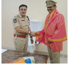
-సీబి కి నిబ్బందికి నన్యానం.

జమ్మికుంట, సెప్టెంబర్ 30( మన వార్త ప్రతినిధి):