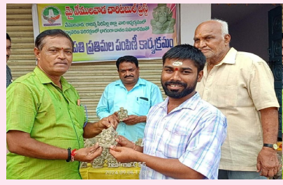
-మై వేములవాడ చారిటబుల్ ట్రస్ట్ వేములవాడ సెప్టెంబర్ 06 ( మన వార్త ప్రతినది దెబ్బటి ప్రవీణ )

వేములవాడ పట్టణంలో నిత్య అన్నదాన కార్యక్రమంతో పాటు పర్యావరణ పరిరక్షణ పై ప్రతి సంవత్సరము మట్టి గణపతులను పూజించండి పర్యావరణాన్ని రక్షించండి అంటూ మై వేములవాడ చారిటబుల్ ట్రస్ట్ ఆధ్వర్యంలో గంగమట్టి గణపతులను పట్టణ ప్రజలకు అందజేశారు.