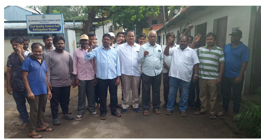
భద్రాద్రి కొత్తగూడెం జిల్లా సెప్టెంబర్ 6( మన వార్తా ప్రతినది)