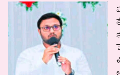
సెప్టెంబర్ 6( మనవార్త ప్రతినది )

మహిళల జోలికొస్తే నా జోలికి వచ్చినట్లే సూర్యాపేట కలెక్టర్ తేజస్ నంద్ లాల్ పవార్ హెచ్చరిక ఆడవాళ్ల జోలికొస్తే ఎస్ కౌంటర్ చేస్తానని సూర్యాపేట కలెక్టర్ తేజస్ నందాల్ పవార్ హెచ్చరించారు. జిల్లా గ్రామీణా భివృద్ధి సంస్థలో మహిళా ఉద్యోగులను వేధిస్తున్నట్లు ఫిర్యాదులు వస్తుండడంపై ఆయన ఆగ్రహం వ్యక్తం చేశారు. డిఆర్ఐవ్ ఆఫీస్ లో మహిళలపై వేధింపులు పెరుగుతుండడంతో మహిళా ఉద్యోగులు ఇటీవల