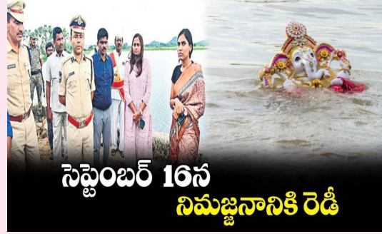
సెప్టెంబర్ 16న నిమజ్జనానికి రెడీ