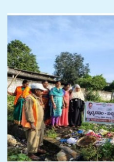
భద్రాద్రి కొత్తగూడెం జిల్లా ఆగస్టు 5 (మన వార్త ప్రతినిధి )