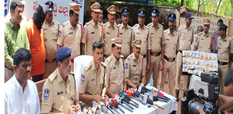
జహీరాబాద్, ఆగస్టు 5 (మన వార్త ప్రతినిధి టి అశోక్ కుమార్):