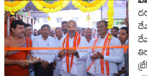
వేములవాడ ఆగస్టు 05 ( మన వార్త ప్రతినిధి దబ్బేటి ప్రవీణ్ )

రాజన్న ఆలయంలో బ్రేక్ దర్శనం ప్రారంభించిన ప్రభుత్వ విప్. దక్షిణ కాశీగా పేరుగాంచిన పేద ప్రజల కోరికలు తీర్చే రాజన్న దేవాలయంలో నేడు బ్రేక్ దర్శనం ప్రారంభించడం శుభవరిణామం తెలంగాణ రాష్ట్ర ప్రభుత్వం దేవాలయ శాఖ వారి ఆధ్వర్యంలో నేడు భక్తులకు శీఘ్ర దర్శనాన్ని ప్రారంభించుకుంటున్నాం. యాదాద్రి తిరుమల తిరుపతి దేవస్థాన తరహాలో వేములవాడ రాజనాలయంలో కూడా శీఘ్రదర్శనాన్ని లభించేలా బ్రేక్ దర్శనం ఏర్పాటు చేసుకున్నాం. నడూరం నుంచి వచ్చే రాజన్న భక్తులకు ఎలాంటి ఇబ్బంది తలెత్తకుండా రాజన్న ఆలయంలో అన్ని సౌకర్యాలను ఏర్పాటు చేస్తాం ప్రతిరోజు ఉదయం 10:15 నుంచి 11:15 వరకు సాయంత్రం నాలుగు 4:00 నుంచి 5:00 నిమిషాల వరకు బ్రేక్ దర్శనం ఏర్పాటు చేస్తున్నాం ప్రతి ఒక్కరికి 300 రూపాయల టికెట్ కేటాయించడం జరిగింది.. కోడే టికెట్లో 500 రూపాయలు ఇవ్వడం జరుగుతుంది. దేశంలోనే ఎక్కడ లేని విధంగా ఆ పరమేశ్వరునికి కోడేని కట్టడం వేములవాడ రాజన్న ఆలయ ప్రసిద్ధిగాంచింది. ఈరోజు ప్రారంభించిన బ్రేక్ దర్శనం పట్ల చిట్టడ మహారాష్ట్ర నుంచి వచ్చిన భక్తులు చాలా ఆనంద వ్యక్తం చేశారు. ఆలయంలో భక్తులకు ఎలాంటి అసౌకర్యాలు కలగకుండా పారిశుధ్య నిర్వహణ మంచినీటి వసతి వంటి మెరుగైన సౌకర్యాలు కల్పిస్తాం. శ్రావణమాసం మొదటిరోజు దర్శనం ప్రారంభించుకోవడం చాలా శుభ వరిణామం రాజన్న ఆలయానికి గత పాలకులు 100 కోట్లు ఇస్తాం అని మోసం చేసారు. వాళ్ళు రంగురంగుల ట్రోచర్లలో అభివృద్ధి చేశారని తప్ప క్షేత్రస్థాయిలో ఎక్కడ కూడా అభివృద్ధి చేయలేదు ప్రభుత్వ ఏర్పడిన మొదటి మూడు నెలల్లోనే విలీడివ సమావేశం ఏర్పాటు చేసి మళ్ళీ ఊయిన 20 కోట్ల నిధులను వెనక్కి తీసుకొచ్చాం. బడ్జెట్లో ఎవరు ఊహించని విధంగా రాజన్న ఆలయానికి 50 కోట్ల నిధులు కేటాయించడం జరిగింది.