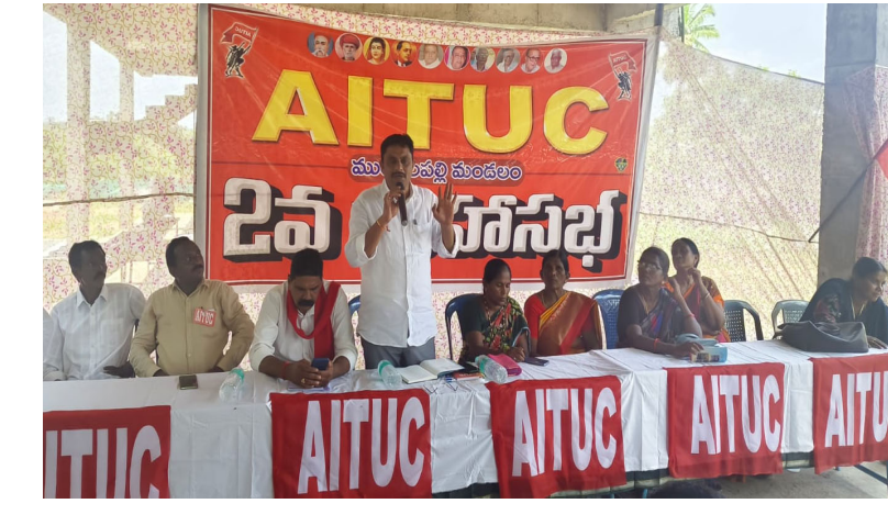
-నాలుగు లేబర్ కోడ్ లకు వ్యతిరేకంగా కార్మి