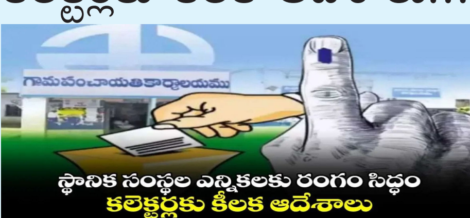
స్థానిక సంస్థల ఎన్నికలకు రంగం సిద్ధం కలెక్టర్లకు కీలక ఆదేశాలు

మన వార్త తెలంగాణలో స్థానిక సంస్థల ఎన్నికల నిర్వహణకు ప్రభుత్వం కనరత్తు మొదలు పెట్టింది. ఈ క్రమంలో ఎన్నికల నిర్వహణకు సంబంధించి గురువారం అన్ని జిల్లాల కలెక్టర్లతో తెలంగాణ రాష్ట్ర ఎన్నికల సంఘం కమిషనర్ పార్లమెంటు వీడియో కాన్ఫరెన్స్ నిర్వహించారు. ఓటర్ జాబితా, పోలింగ్ బూత్ల ఏర్పాటుతో పాటు ఇతర అంశాలపై చర్చించారు. రానున్న నాలుగైదు నెలల వ్యవధిలో స్థానిక సంస్థల ఎన్నికలు పూర్తి చేసేందుకు అందరూ సమాయత్తం కావాలని ఈ సందర్భంగా కలెక్టర్లను కమిషనర్ ఆదేశించారు. కాగా, మూడు దశల్లో గ్రామ పంచాయతీ ఎన్నికలు నిర్వహించాలని రాష్ట్ర ఎన్నికల సంఘం నిర్ణయించింది. మొదట సర్పంచ్, తర్వాత జెడ్పీ, ఎంపీటీసీ ఆ తర్వాత మునిసిపల్ ఎన్నికలు నిర్వహించనున్నారు. సెప్టెంబర్ 6వ తేదీన ఎన్నికల షెడ్యూల్ డ్రాఫ్ట్ నోటిఫికేషన్, 21వ తేదీన పైనల్ ఓటర్ లిస్ట్?ను ఎన్నికల సంఘం ప్రకటించనుంది. ఒక్కో పోలింగ్ కేంద్రం పరిధిలో 600 ఓటర్లు.. 650 ఓట్లు దాటితే అదనపు పోలింగ్ కేంద్రాలు ఏర్పాటు చేయాలని ఈసీ డిసైడ్ అయ్యింది. లోకల్ బాడీ ఎన్నికలకు ప్రభుత్వం కనరత్తు మొదలు పెట్టడంతో రాష్ట్రంలోని ప్రధాన పార్టీలు ఎన్నికలకు సిద్ధం అవుతున్నాయి. అధికారంలో ఉన్న కాంగ్రెస్ పార్టీ మెజార్టీ సీట్లు దక్కించుకోవాలని వ్యూహాలు మొదలుపెట్టగా.. బీఆర్ఎస్, బీజేపీ లోకల్ బాడీ ఎన్నికల్లో సత్తా చాటేందుకు ప్రణాళికలు రచిస్తున్నాయి.