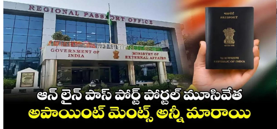
ఆన్ లైన్ పాస్ పోర్ట్ పోర్టల్ మూసివేత అపాయింట్ మెంట్స్ అన్నీ మారాయి

మన వార్త ఆన్ లైన్ పాస్ పోర్ట్ పోర్టల్ మూతపడింది. పాస్ పోర్ట్ కోసం అప్లై చేసుకునే ఆన్ లైన్ పోర్టల్ ఇవాళ ( ఆగస్టు 29, 2024 ) రాత్రి 8 గంటల నుండి 5 రోజుల పాటు ముసివేయనున్నట్లు తెలిపింది ప్రభుత్వం. ఈ ఐదు రోజుల వ్యవధిలో ( సెప్టెంబర్ 2 వరకు ) కొత్త అపాయింట్మెంట్స్ స్వీకరించబడవని తెలిపింది. ముందుగా బుక్ చేసుకున్న అపాయింట్మెంట్స్ రీషెడ్యూల్ చేయబడతాయని, మెయింటెనెన్స్ లో భాగంగానే ఈ నిర్ణయం తీసుకున్నట్లు స్పష్టం చేసింది ప్రభుత్వం. ఈ క్రమంలో పోర్టల్ నకిలి వెబ్ సైట్ల పట్ల అప్రమత్తంగా ఉండాలని సూచించింది ప్రభుత్వం. చాలా నకిలి వెబ్ సైట్లు, మొబైల్ అప్లికేషన్లు దరఖాస్తుదారుల నుండి డేటాను సేకరిస్తున్నాయని, ఆన్ లైన్ దరఖాస్తు ఫారమ్ నింపడానికి, పాస్ పోర్ట్ మరియు సంబంధిత సేవల కోసం అపాయింట్ మెంట్ షెడ్యూల్ చేయడానికి అదనపు భారీ ఛార్జీలు వసూలు చేస్తున్నట్లు తమ దృష్టికి వచ్చిందని తెలిపింది. నకిలి వెబ్ సైట్ల పట్ల అప్రమత్తంగా ఉండాలని, పాస్ పోర్ట్ అప్లై చేయటం కొనసాగించే మెంట్స్ చేయద్దని సూచించింది. దరఖాస్తు కోసం భారత ప్రభుత్వ విదేశీ వ్యవహారాల మంత్రిత్వ శాఖ అధికారిక వెబ్ సైట్ www.passportindia.gov.in ద్వారా మాత్రమే అప్లై చేసుకోవాలని తెలిపింది.