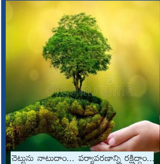
చెట్టును నాటడాం... పర్యావరణాన్ని రక్షిద్దాం..