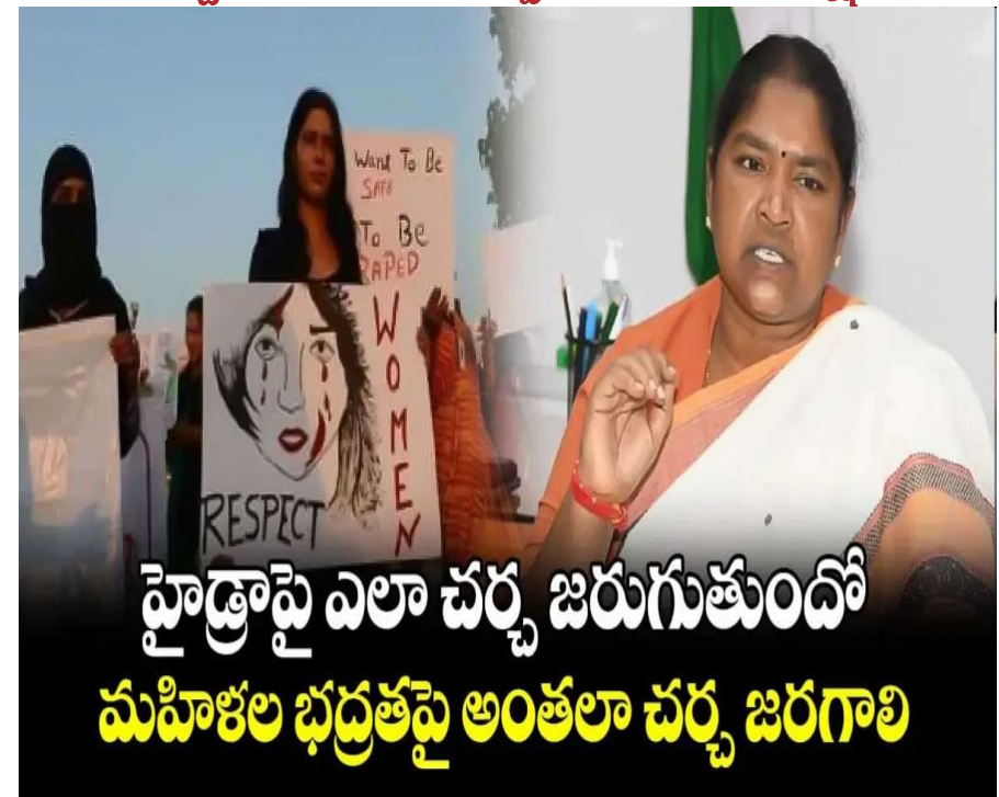
హైద్రాబాద్ ఎలా చర్చ జరుగుతుందో మహిళల భద్రతపై అంతలా చర్చ జరగాలి

మన వార్త ప్రస్తుతం హైద్రాబాద్ ఎలా చర్చ జరుగుతుందో.. మహిళల భద్రతపై అంతలా చర్చ జరగాలన్నారు మంత్రి సీతక్క. నేరాలను కట్టడి చేయాలంటే తప్పు జరిగిన వెంటనే శిక్ష పడాలన్నారు. నేరాలు జరగకుండా ఆలోచనలు సక్రమంగా ఉండాలంటే తరగతి గదుల నుంచే విద్యార్థులకు సరైన అవగాహన కల్పించాలన్నారు సీతక్క. మాదక ద్రవ్యాల ప్రభావం హత్యలకు కారణం అవుతోందన్నారు సీతక్క. పని ప్రదేశాల్లో మహిళలు క్షేమంగా ఉండాలని చెప్పారు. కోల్ కతా మహిళా డాక్టర్ ఫుటన్ యావత్ దేశాన్ని కుదిపేసిందన్నారు. ఎక్కడైనా ఎవరిపైనా ఏ ఘటన జరిగినా ప్రతి ఒక్కరు బాధ్యతగా ఉండాలన్నారు. విమెన్ సేఫ్టీ వింగ్ తో కొన్ని సమావేశాలు ఏర్పాటు చేసి నేరాల కంట్రోల్ కు చర్యలు తీసుకుంటామని చెప్పారు. పాఠ్య పుస్తకాల్లో చట్టాల గురించి తెలియజేసేలా కృషి చేస్తామన్నారు సీతక్క.