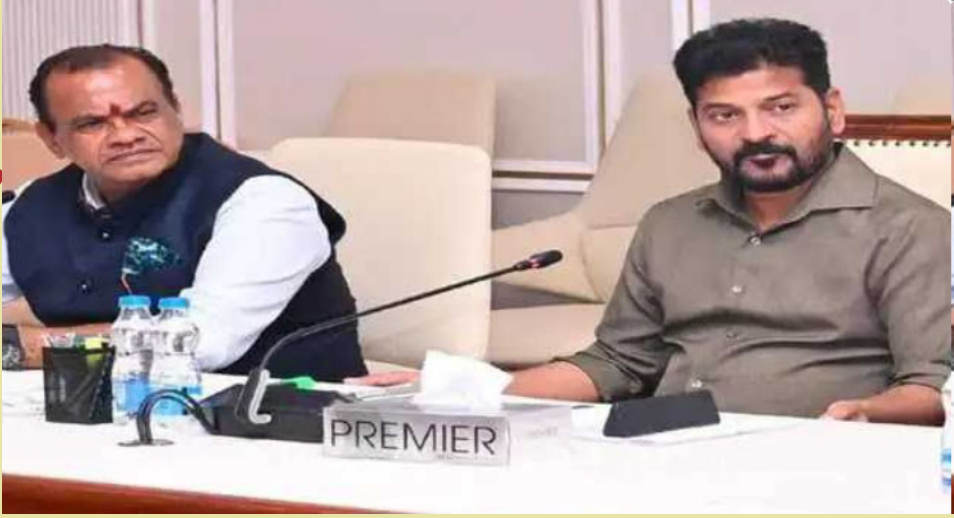
భద్రాద్రి కొత్తగూడెం జిల్లా అగస్టు 25( మన వార్త ప్రతినిధి )

హైదరాబాద్ జిల్లాలోని అక్రమ నిర్మాణాలను వదిలేస్తే తాను ప్రజాప్రతినిధిగా విఫలమైందనే సీఎం రేవంత్ రెడ్డి అన్నారు ఆయన మాట్లాడుతూ హైదరాబాదు లేక్ సిటీ హైదరాబాదును రక్షించుకోవాలని బాధ్యత అందరిపైనూ ఉందన్నారు ఎంత ఒత్తిడి వచ్చిన మన దగ్గర మిత్రులకు ఫామ్ హౌస్ లో ఉన్న చెరువుల్లో అక్రమ నిర్మాణాలను వదిలేద్దామని అక్రమ కట్టడాల కూల్చివేతకు భగవద్దీత నాకు స్ఫూర్తి అన్నారు రాజకీయం కోసమే నాయకులపై కక్షతోనా ఇవి చేయడం లేదు అక్రమ కట్టడాల కూల్చివేతకు అందరూ సహకరించాలని కోరారు