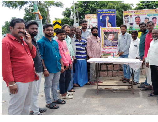
జళ్ళందకుంట, ఆగస్టు 25( మన వార్త ప్రతినిధి):