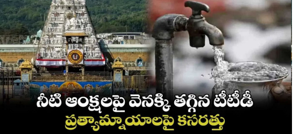
నీటి ఆంక్షలపై వెనక్కి తగ్గిన బేబీడే ప్రత్యామ్నాయాలపై కసరత్తు

సరఫరా కోసం ప్రత్యామ్నాయ ఏర్పాట్లపై కసరత్తు చేస్తున్నట్లు సమాచారం. ఈ మేరకు మున్సిపల్ అధికారంతో బేబీడే ఈవో సమావేశమయ్యి తిరుమలకు కావాల్సిన నీటి కేటాయింపులు పెంచేందుకు చర్యకు జరపనున్నట్లు సమాచారం. షోలిసుల ఎనుట లొంగిపోయిన మైనర్ మావోయిస్టు... ప్రభుత్వ ప్రాజెక్టులో చేరాడు. పలు కేసులలో నిందితుడిగా ఉండటమే కాకుండా.. గతంలో అనేక ప్రభుత్వ వ్యతిరేక సంఘటనల్లో ప్రత్యక్షంగా పాల్గొన్నట్లు మల్కాగిరి పోలీసులు పేర్కొన్నారు. ఛత్తీస్ గఢ్ - ఒడిస్సా ప్రభుత్వాల లొంగిపోయిన మావోయిస్టుల కోసం చేపట్టిన పలు పథకాలకు ఆకర్షణపై మావోయిస్టుల సిద్ధాంతాల నుంచి తిరిగి జనజీవ ప్రవంతిలో కలుస్తున్నట్లు ముఖ్యే కోర్చు పేర్కొన్నారు.