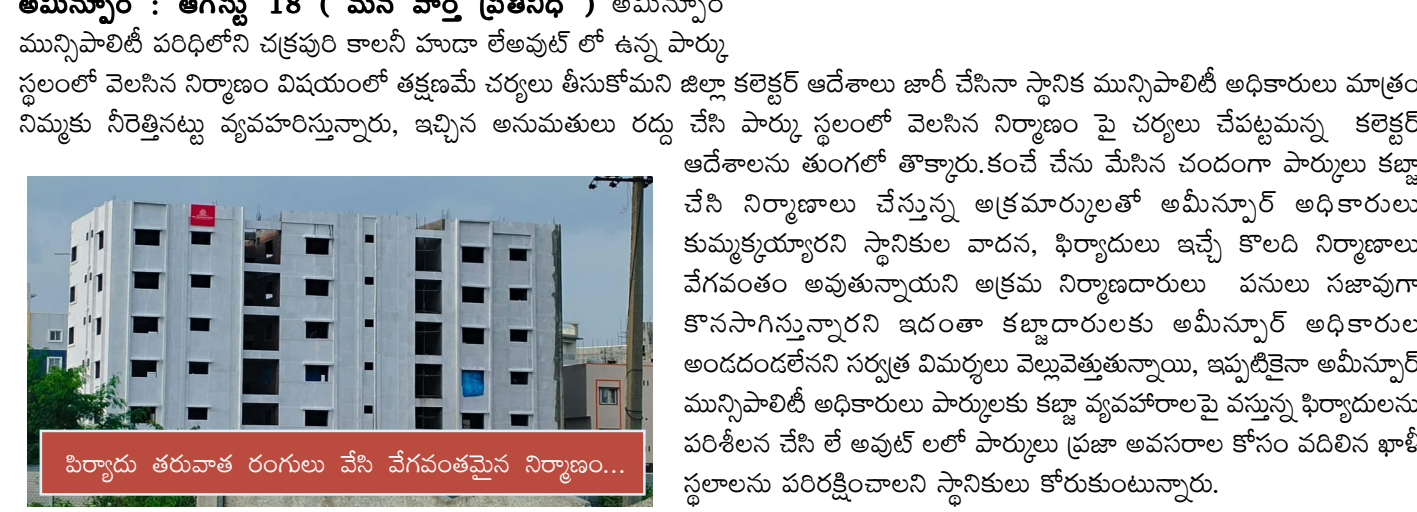
పార్కు స్థలంలో వెలసిన నిర్మాణం.....

అమీన్యూర్ : ఆగస్టు 18 ( మన వార్త ప్రతినధి ) అమీన్యూర్ మున్సిపాలిటీ పరిధిలోని చక్రపురి కాలనీ చుదా లేఅవుట్ లో ఉన్న పార్కు స్థలంలో వెలసిన నిర్మాణం విషయంలో తక్షణమే చర్యలు తీసుకోమని జిల్లా కలెక్టర్ ఆదేశాలు జారీ చేసినా స్థానిక మున్సిపాలిటీ అధికారులు మాత్రం నిమ్మకు నీరెత్తినట్టు వ్యవహరిస్తున్నారు, ఇచ్చిన అనుమతులు రద్దు చేసి పార్కు స్థలంలో వెలసిన నిర్మాణం పై చర్యలు చేపట్టమన్న కలెక్టర్ ఆదేశాలను తుంగలో తొక్కారు. కంచే చేసు మేసిన చందంగా పార్కులు కబ్జా చేసి నిర్మాణాలు చేస్తున్న అక్రమార్కులతో అమీన్యూర్ అధికారులు కుమ్మక్కయ్యారని స్థానికుల వాదన, ఫిర్యాదులు ఇచ్చే కొలది నిర్మాణాలు వేగవంతం అవుతున్నాయని అక్రమ నిర్మాణదారులు పనులు సజావుగా కొనసాగిస్తున్నారని ఇదంతా కబ్జాదారులకు అమీన్యూర్ అధికారులు అందడందలేనని సర్కల్ విమర్శలు వెల్లవెత్తుతున్నాయి, ఇప్పటికైనా అమీన్యూర్ మున్సిపాలిటీ అధికారులు పార్కులకు కబ్జా వ్యవహారాలపై వస్తున్న ఫిర్యాదులను పరిశీలించి లే ఆవుట్ లో పార్కులు ప్రజా అవసరాల కోసం వదిలిన ఖాళీ స్థలాలను పరిరక్షించాలని స్థానికులు కోరుకుంటున్నారు.