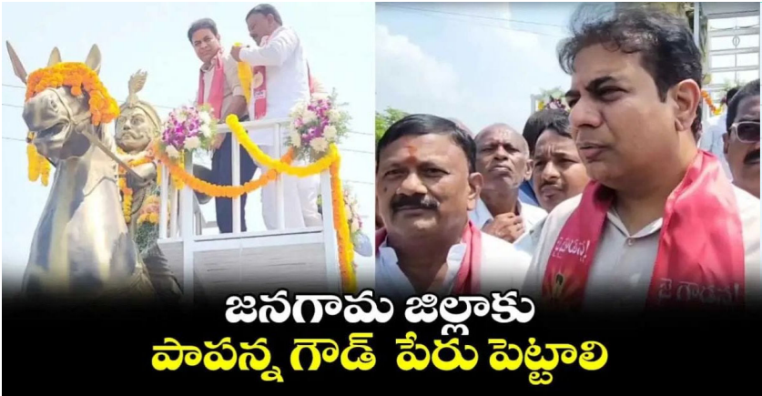
జనగామ జిల్లాకు పాపన్న గౌడ్ పేరు పెట్టాలి

-బీఆర్ఎస్ వర్కింగ్ ప్రెసిడెంట్ కేటీఆర్..