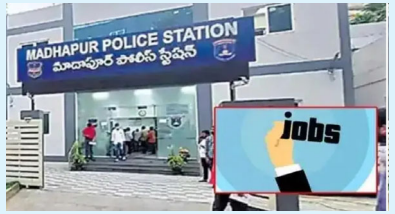
భద్రాద్రి కొత్తగూడెం జిల్లా ఆగస్టు 18 (మన వార్తా ప్రతినిధి) హైదరాబాద్ లో మరో సాఫ్ట్వేర్ కంపెనీ బోర్డు తిప్పేసింది. మాదాపూర్లోని అయ్యప్ప సొసైటీ 100 ఫీట్ రోడ్డులో 'డ్రైడే ఆఫ్ కన్సల్టెన్సీ' కంపెనీ ఏర్పాటు చేసింది. దాదాపు 200 నిరుద్యోగుల నుంచి రూ. 1,50,000 వసూలు చేసింది. ట్రైనింగ్ ఇచ్చి ఉద్యోగం ఇస్తామని కంపెనీ ప్రతినిధులు నమ్మించారు. కార్యాలయానికి తాళం వేయడంతో గ్రహించిన బాధితులు మోసపోయామని లభోదిబో మంటున్నారు. ఈ ఘటనపై మాదాపూర్ పీసీ లో ఫిర్యాదు చేశారు. అలాగే ఈ సంస్థకు విజయవాడ, బెంగళూరులో బ్రాంచు ఉన్నట్లు సమాచారం.