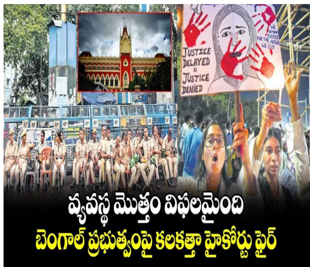
వ్యవస్థ మొత్తం విఫలమైంది బెంగాల్ ప్రభుత్వంపై కలకత్తా హైకోర్టు ఫైర్