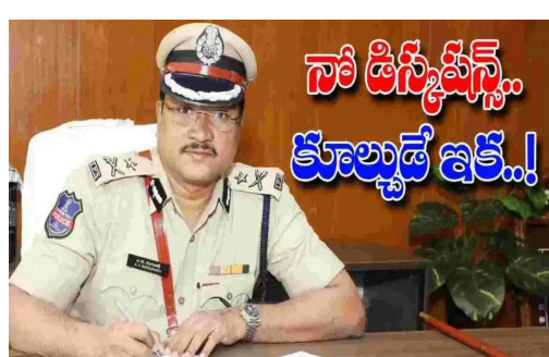
సో డిస్కంప్లెస్.. కూల్చుడే ఇక్క..!