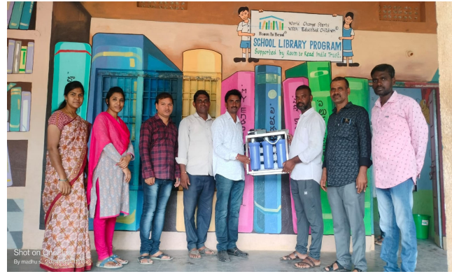
(గంభీరాపుపేట్ ఆగస్టు 14 మన వార్త ప్రతినది)

పటాన్ చెరువు ఆగస్టు 14 (మన వార్త ప్రతినది): తెలంగాణలో ఎక్కడ చూసినా విశాఖురం ఎమ్మెల్యే గారి తాలూకా అంటూ కార్లు బైకులు దర్శనమిస్తున్నాయి, నెంబర్ ప్లేట్లు పై మరియు కారు అడ్డాల పైన ఆ విధంగా రాసుకోవడంకంటూ కొన్ని వేదికలపై నుండి ఆంధ్రప్రదేశ్ ఉప ముఖ్యమంత్రి సిని హీరో పవన్ కళ్యాణ్ కొన్నిసార్లు చెప్పడం జరిగింది కానీ అభిమానులు వాళ్ల అభిమానానికి అంతు లేదని తెలియజేస్తూ తెలంగాణ జిల్లాలలో కూడా విశాఖురం ఎమ్మెల్యే గారి తాలూకా అంటూ నెంబర్ ప్లేట్ పై వేసుకోవడం ఈ రోజుల్లో పరిపాలనా మారింది పవన్ ఒక వ్యక్తి కాదని మహాశక్తి అని పవన్ కళ్యాణ్ లాంటి నాయకుడు తెలంగాణకు సీఎం కావాలని అతని అభిమానులు వాళ్ళ అభిప్రాయాన్ని వ్యక్తం చేశారు.