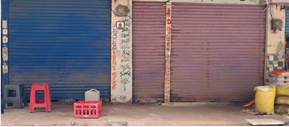
జమ్మికుంట, ఆగస్టు 14( మన వార్త ప్రతినది):

జమ్మికుంట పట్టణం బండ్ పాటించిన వర్తక వ్యాపారస్తులు. బంగ్లాదేశ్ లో హిందువులపై జరుగుతున్న దాడులకు నిరసనగా హిందూ ఐక్యవేదిక అధ్యక్షులలో జమ్మికుంట పట్టణంలో బండ్ నిర్వహించారు. జమ్మికుంట పట్టణంలోని కిరాణి వర్తక వ్యాపార సంస్థలు, పాఠశాలలు స్వచ్ఛందంగా బండ్ పాటించారు. భారత దేశ ప్రజలు ప్రజలు కులమతాలకు అతీతంగా వుండి దాడులను తిప్పికొట్టాలని పిలుపునిచ్చారు. ఈ కార్యక్రమంలో హిందూ ఐక్యవేదిక సభ్యులు తదితరులు పాల్గొన్నారు.