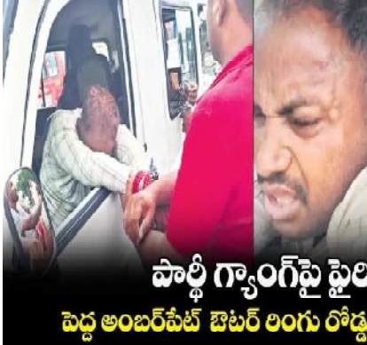
పార్టీ గ్యాంగ్ పై ఫైరింగ్ పెద్ద అంబర్ పేట్ ఔటర్ రింగు రోడ్డు వద్ద హైదరాబాద్