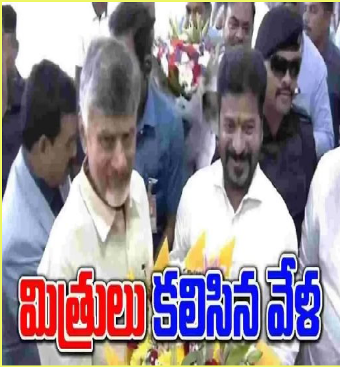
మిత్రులు కలిసిన వేళ

హైదరాబాద్ మన వార్త : ఎన్నో విఠ్లుగా సింగరేణి ఎదుర్కుంటున్న సమస్యకు పులస్తాప్ పెట్టారు కేంద్రమంత్రి కిషన్ రెడ్డి. ఆగష్టు 13, 2015న 10 మిలియన్ టన్నుల ఉత్పత్తి సామర్థ్యం కలిగిన ఒడిశాలోని వైసీ బొగ్గు గనిని సింగరేణి కాలరీన్ కంపెనీ లిమిటెడ్ (ఎస్సీసీఎల్)కు కేటాయించింది కేంద్ర ప్రభుత్వం. అయితే అక్టోబర్ 2022లో స్టేజి-2 ఫార్వర్డ్ క్లియరెన్స్ అందిన తర్వాత అటవీ భూమిని అప్పగించడంలో ఒడిశాకు చెందిన వైసీ బొగ్గు గని తీవ్ర జాప్యాన్ని ఎదుర్కుంటుంది. దీని వల్ల గని కార్యాచరణలో కూడా అసాధారణమైన అలస్యం కలుగుతోంది. ఈ సమస్య ఇటీవల కేంద్ర బొగ్గు, గనుల శాఖ మంత్రి కిషన్ రెడ్డి దృష్టికి వెళ్లడంతో ఆయన వెంటనే ఒడిశా ప్రభుత్వంతో విస్తృత స్థాయి చర్చలు జరిపారు. దీర్ఘకాలంగా పెండింగ్ లో ఉన్న ఈ సమస్యను పరిష్కరించి, గనిని వీలైనంత త్వరగా ప్రారంభించేందుకు ఒడిశా ప్రభుత్వం సహకరించాలని కోరారు. ఒడిశా ప్రభుత్వం కూడా దీనికి అంగీకారం తెలపడంతో జూలై 4న, సింగరేణి కాలరీన్ కంపెనీ లిమిటెడ్ కు 643 హెక్టార్ల అటవీ భూమిని అప్పగించడానికి ఆమోదం వచ్చింది. ఈ సమస్యను త్వరగా పరిష్కరించడంలో సహాయపడిన ఒడిశా సీఎం మోహన్ చరణ్ మాండ్లికి ధన్యవాదాలు తెలిపారు కిషన్ రెడ్డి. త్వరలోనే ఎస్సీసీఎల్ గని నుంచి ఉత్పత్తిని ప్రారంభిస్తుందని తద్వారా తెలంగాణ ఇంధన భద్రత అవసరాలు మరింత బలోపేతం అవుతాయని ఆశాభావం వ్యక్తం చేశారు కేంద్రమంత్రి.