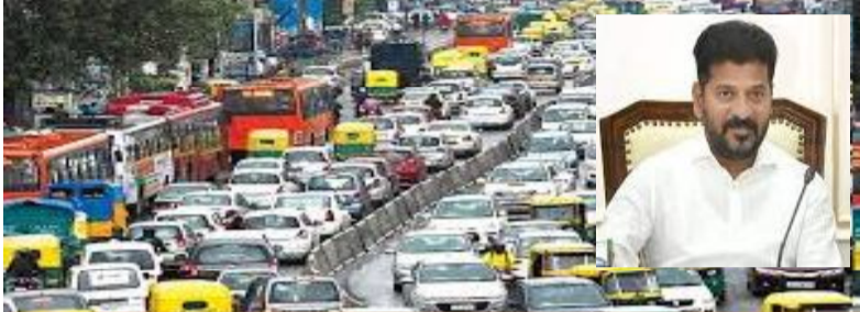
నిబంధనలకు సీట్లెబిల్ వాహనదారులకు కక్షం

రేవంత్ రెడ్డి ప్రభుత్వం సంచలన నిర్ణయానికి సిద్ధం