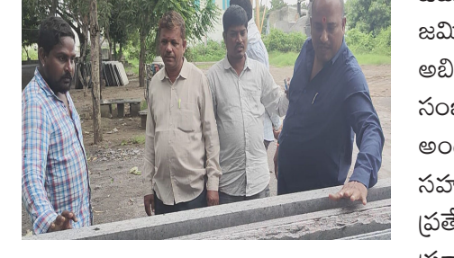
జమ్మికుంట, జూలై 24( మన వార్త ప్రతినిధి):