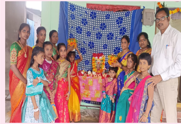
జమ్మికుంట, జూలై 24( మన వార్త ప్రతినిధి):

జమ్మికుంట మున్సిపల్ పరిధి కొత్తపల్లిలోని సాహితి ఫౌండేషన్ ఆధ్వర్యంలో నిర్వహిస్తున్న గార్డయన్ ఇంగ్లీష్ మీడియం స్కూల్లో గురువారం లన్నర్ బోనాలు ఘనంగా నిర్వహించారు. దీనిలో భాగంగా మహంకాళి అమ్మవారి చిత్రపటానికి పూలు వందల సంఖ్యలో వేసి, మట్టి