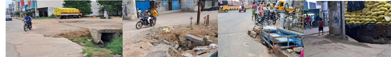
ఆర్ ఓ బీ వంతెన సమీపంలో రైల్వే పాత గేటు నుంచి బస్టాండ్ కు వెళ్ళే దారిలో కారవల్లి రోడ్ బిడ్డి జంక్షన్

జమ్మికుంట, జూలై 17( మన వార్త ప్రతినిధి): వర్షాలలో మరోముప్పు పట్టణ వాసులను కలవరపెడుతోంది. అసంపూర్ణి డ్రైనేజీలు, శిథిలావస్థకు చేరిన డ్రైనేజీలు, దారి మూల మలుపులో డ్రైనేజీలు మృత్యువు కోసం నోర్లు తెరుచుకొని కాచుకు కూర్చున్నాయి. పట్టణంలోని ఆర్ ఓ బీ వంతెన ప్రాంతం సమీపంలో వున్న పెట్రోల్ బంక్ వద్ద మురికి కాలువ నిర్మాణం అసంపూర్ణిగా వదిలేయడంతో శిథిలావస్థకు చేరింది. వరద నీటితో పెద్ద గొయ్యిగా తయారైంది. కారవల్లి కి వెళ్ళే దారిలో మురికి కాలువ, బిడ్డి జంక్షన్ వద్ద మూల మలుపులో వున్న డ్రైనేజీ ప్రమాదకరంగా తయారైంది. రైల్వే పాత గేటు వద్ద నుండి బస్టాండ్ వెళ్ళే దారిలో మురికి కాలువ పూర్ణిగా శిథిలావస్థకు చేరింది. వాహనాలు అదుపుతప్పితే అంతే సంగతులు. అదేవిధంగా అంతర్గత రోడ్ల పై మ్యూన్ హెల్త్ ప్రజలను కలవర పెడుతున్నాయి. అతిపెద్ద వ్యాపార కేంద్రంగా పేరున్న జమ్మికుంట చుట్టుప్రక్కల గ్రామాలకు ఆయువు పట్టు. ప్రక్కన వుండే మండలాల ప్రజలు, విద్య, వ్యాపారం, ఉద్యోగం, వివిధ పనుల నిమిత్తం పట్టణానికి వస్తూ వెళ్తుంటారు. నిత్యం వందలాది వాహనాలు, వేలాది మంది సంచరించే పట్టణంలో ఇలాంటి ప్రమాద ఘంటికలు నెలకొని ఉన్నాయి. చర్యలు తీసుకోవాలని అధికారులు పట్టణం చుట్టూ పరిశీలించి, మునిసిపల్ అధికారులు దృష్టి సారించకపోవడంతో ప్రమాదం పొంచి ఉంది. అటునుంచి వెళ్లాలంటే ప్రజలు భయాందోళనకు గురవుతున్నారు. అధికారులు స్పందించి ప్రమాదాలు జరగకుండా రక్షణ చర్యలు చేపట్టాలని ప్రజలు కోరుతున్నారు.