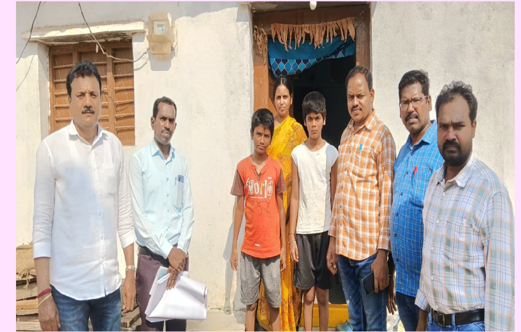
గంభీరాపుపేట, జూన్ 6(మన వార్ల ప్రతినిధి)