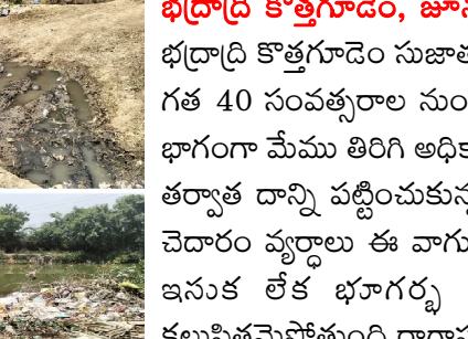
భద్రాద్రి కొత్తగూడెం, జూన్ 1 (మన వార్త ప్రతినిధి పాలుగున)

భద్రాద్రి కొత్తగూడెం సుజాతనగర మండలం గొల్లగూడెం గ్రామం నుంచి రాగాపురం పోయే రహదారి గత 40 సంవత్సరాల నుంచి చెట్లు పుట్టల తోటి దుర్భరంగా ఉంది. ఎలక్షన్ల ముందు ప్రచారంలో భాగంగా మేము తిరిగి అధికారంలోకి రాగానే ఈ రోడ్డుని వేస్తామని చెప్పామని చెప్పారు. ఎన్నికల అయిపోయిన తర్వాత దాన్ని పట్టించుకున్న నాయకుడు లేరని ప్రజలు వాపోతున్నారు. గొల్లగూడెంలో ఉన్న చెత్త చెదారం వ్యర్థాలు ఈ వాగులో వేయడంతో వాగు అంతా కలుషితం అవుతుంది. ఒకపక్క వాగులు ఇసుక లేక భూగర్భ జలాలు ఎండిపోతావుంటే మరోపక్క చెత్తాచెదారంతో వాగు కలుషితమైపోతుంది.రాగాపురం గొల్లగూడెం సుజాతనగర్ కలుపుకొని ఉన్న ఈ రహదారిని కొంత మంది భూముల విలువలు పెరగడంతో ఇదే అదునుగా చూసుకొని కట్టా చేయడానికి ప్రయత్నిస్తున్నారు. ఈ విషయం అధికారులకు ఎన్నిసార్లు చెప్పిన పట్టించుకోవడం లేదు ఊర్లో ఉన్న వరద మురుగునీరు వచ్చి వాగులో కలుస్తున్నాయని, వరదొచ్చినప్పుడు మూడు కిలోమీటర్లు పోవాల్సిన పరిస్థితి ఈ దారి గుండా పోవాలంటే అంత బురద మయం కావడంతో రైతులు చాలా ఇబ్బందుల పడుతున్నారు మాకు ఈ రోడ్డు వేయించాలని అధికారులను నాయకులను గొల్లగూడెం ప్రజలు కోరుకుంటున్నారు.