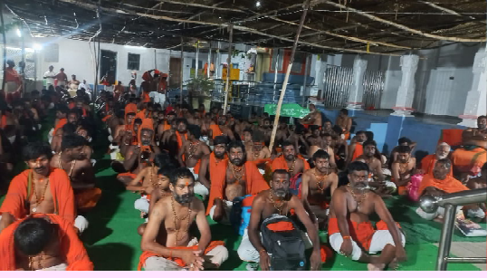
ఇల్లంతకుంట,జూన్ 1( మన వార్త ప్రతినిధి దేవేందర్ )

కరీంనగర్ జిల్లాలోని అపర భద్రాద్రిగా పేరుగాంచిన శ్రీ సీతారామచంద్రస్వామి దేవాలయంలో ఘనంగా హనుమాన్ జయంతి వేడుకలు నిర్వహించారు.