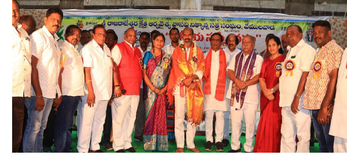
వేములవాడ, జూన్ 01 (మన వార్త ప్రతినిధి ):

-సమాజంలో ఆర్యవైశ్యల పాత్ర మరువలేనిది -ప్రభుత్వ విప్ ఆది శ్రీనివాస్..