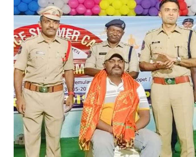
వేములవాడ, జూన్ 01 (మన వార్త ప్రతినిధి నందు రావు):

హనుమాన్ పెద్ద జయంతి సందర్భంగా రాజన్న సిరిసిల్ల జిల్లా వేములవాడ అర్చన్ మండలం అగ్రహారం జోడప ఆంజనేయస్వామి ఆలయం భక్తులతో కిక్కిరిసిపోయింది. జయంతి సందర్భంగా అర్చకులు ఆంజనేయస్వామికి ప్రత్యేక పూజలు నిర్వహించారు. సాధారణ భక్తులతోపాటు హనుమాన్ మాల ధారణ స్వాములతో అగ్రహారం ఆలయ ప్రాంగణం కాషాయమయంగా మారింది. మాల ధారణ స్వాములు అగ్రహారం ఆంజనేయస్వామిని దర్శించుకున్న అనంతరం కొండగట్టు అంజన్ను సన్నిధికి వెళ్లి మాల విరమణ చేస్తారు.