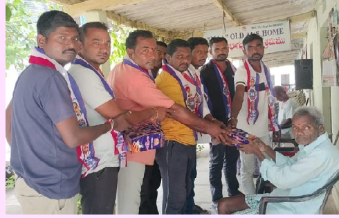
-వృద్ధాశ్రమంలో పండ్లు, బ్రేడ్ ల పంపిణీ చేసిన బీసీ సంక్షేమ సంఘం నాయకులు.