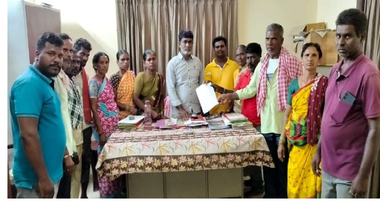
గంభీరావుపేట, జూన్ 1(మన వార్త ప్రతినిధి)

- ఈవోకు వినతి పత్రం సమర్పించిన పారిశుద్ధ కార్మికులు