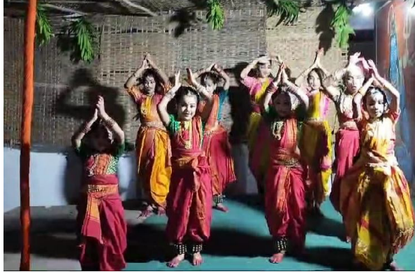
జమ్మికుంట, మే 29(మన వార్త ప్రతినది):