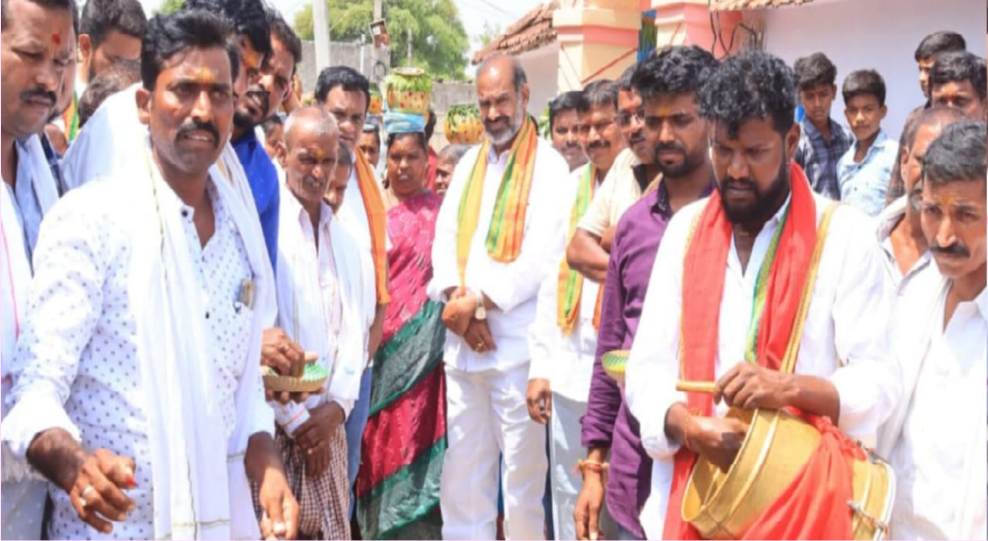
వేములవాడ, మే 29 (మన వార్త ప్రతినది):