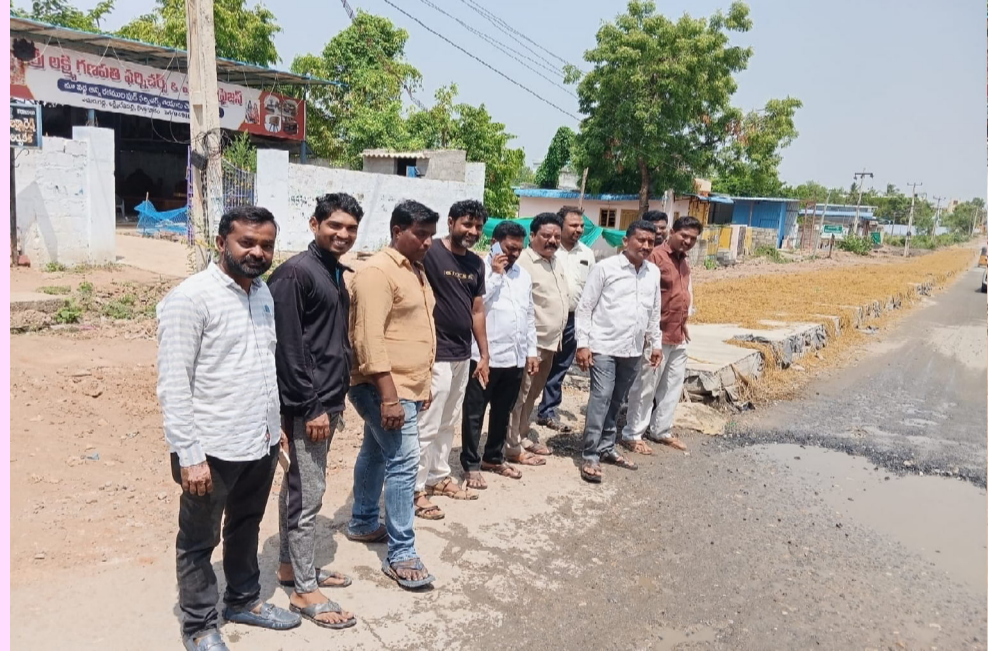
భద్రాద్రి కొత్తగూడెం మే 28 (మన వార్త ప్రతినది పాలుగున)