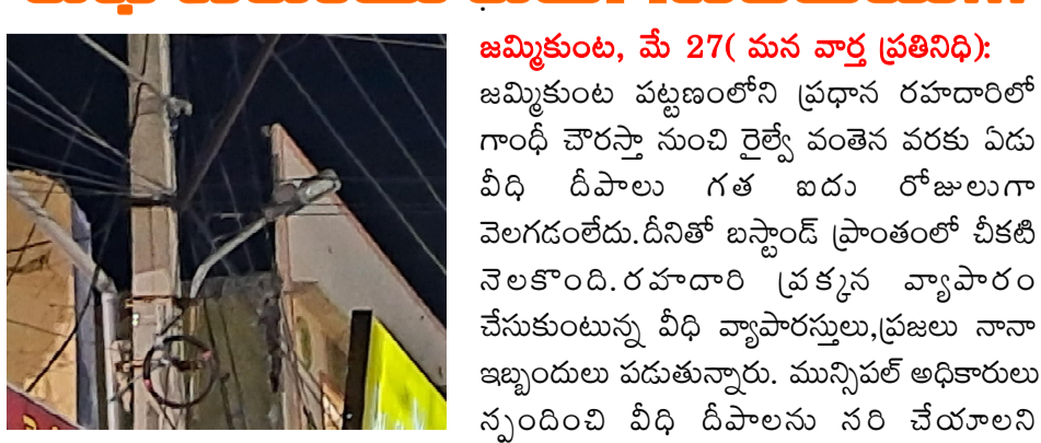
జమ్మికుంట, మే 27 ( మన వార్త ప్రతినధి):

జమ్మికుంట పట్టణంలోని ప్రధాన రహదారిలో గాంధీ చౌరస్తా నుంచి రైల్వే వంతెన వరకు ఏడు వీధి దీపాలు గత ఐదు రోజులుగా వెలగడంలేదు. దీనితో బస్టాండ్ ప్రాంతంలో చీకటి నెలకొంది. రహదారి ప్రక్కన వ్యాపారం చేసుకుంటున్న వీధి వ్యాపారస్తులు, ప్రజలు నానా ఇబ్బందులు పడుతున్నారు. మున్సిపల్ అధికారులు స్పందించి వీధి దీపాలను సరి చేయాలని కోరుతున్నారు.