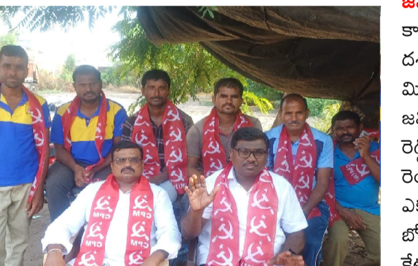
జమ్మికుంట, మే 22( మన వార్తా ప్రతినిధి):