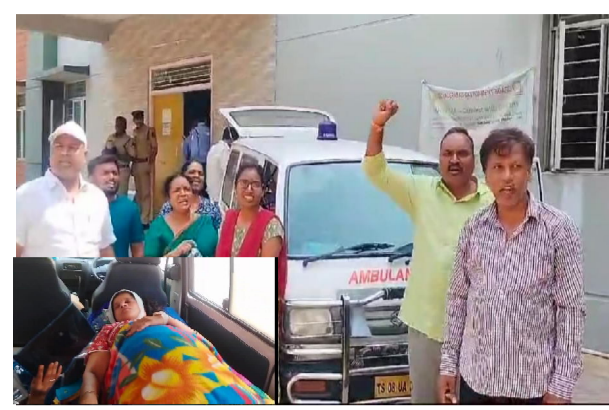
సికింద్రాబాద్ మే 22